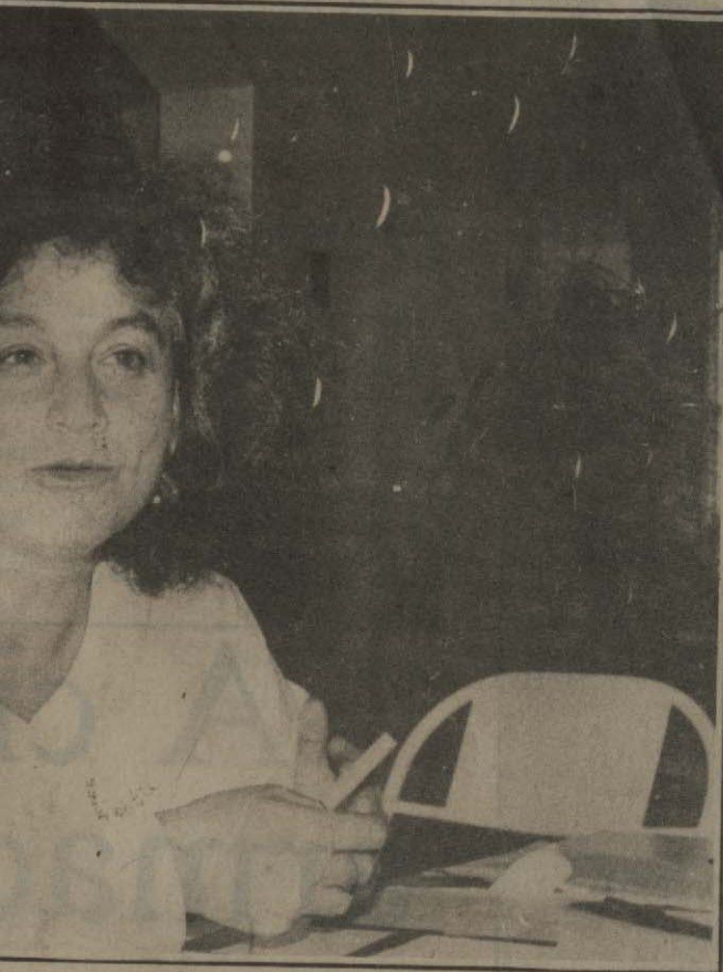
a diretora/produtora do documentário, "Ori"

da cesso Político e Cultural") e realizou o média- metragem "Ylê Xoroquê", traz uma série de nomes famosos para a ficha técnica do seu filme.