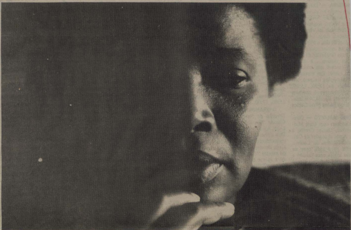
“Ori”, um filme que retrata a dura realidade brasileira