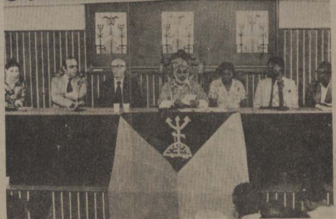
“Ori”, de Rachel Gerber: prêmio do júri