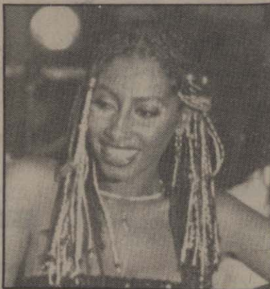
Cena do filme de Raquel Gerber