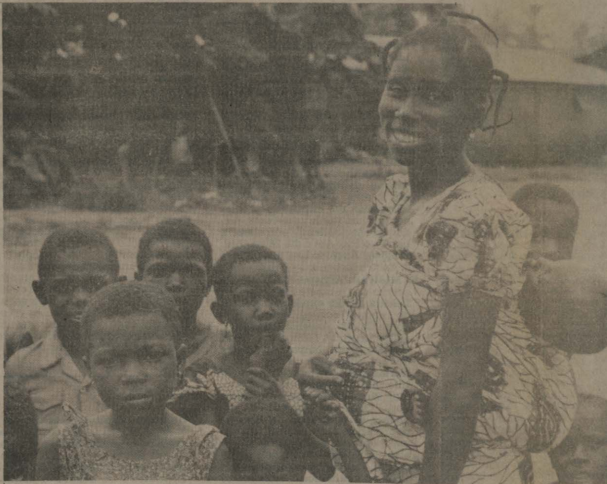
Cena de Ori, tomada na Costa do Marfim

Os filmes em competição concorrem a dois grandes prêmios: Etalom de Yennenga para filmes produzidos na África (concoreram 79 filmes) e Paul Robeson para filmes produzidos no resto do mundo. O filme Ori concorreu com 25 representantes de: EUA, Inglaterra, França, Argentina, URSS, Cuba, Índia, etc. Paralelamente houve ainda uma mostra de mercado, onde participaram aproximada-