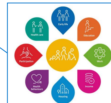
The Public Health Policy