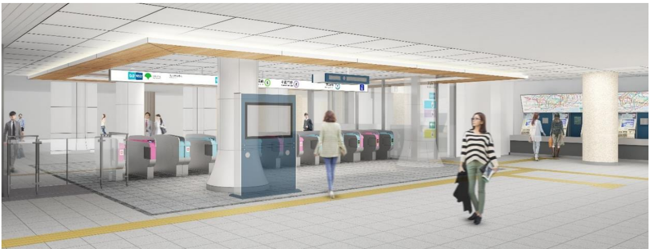
3線共通改札口イメージ（靖国神社・武道館方面改札）