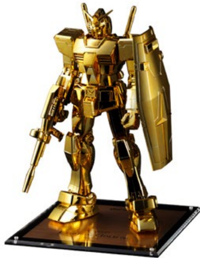
1/48 スケール メガサイズモデルガンダム プレミアムゴールド ver