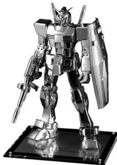
1/48 スケール メガサイズモデルガンダム プレミアムシルバー ver