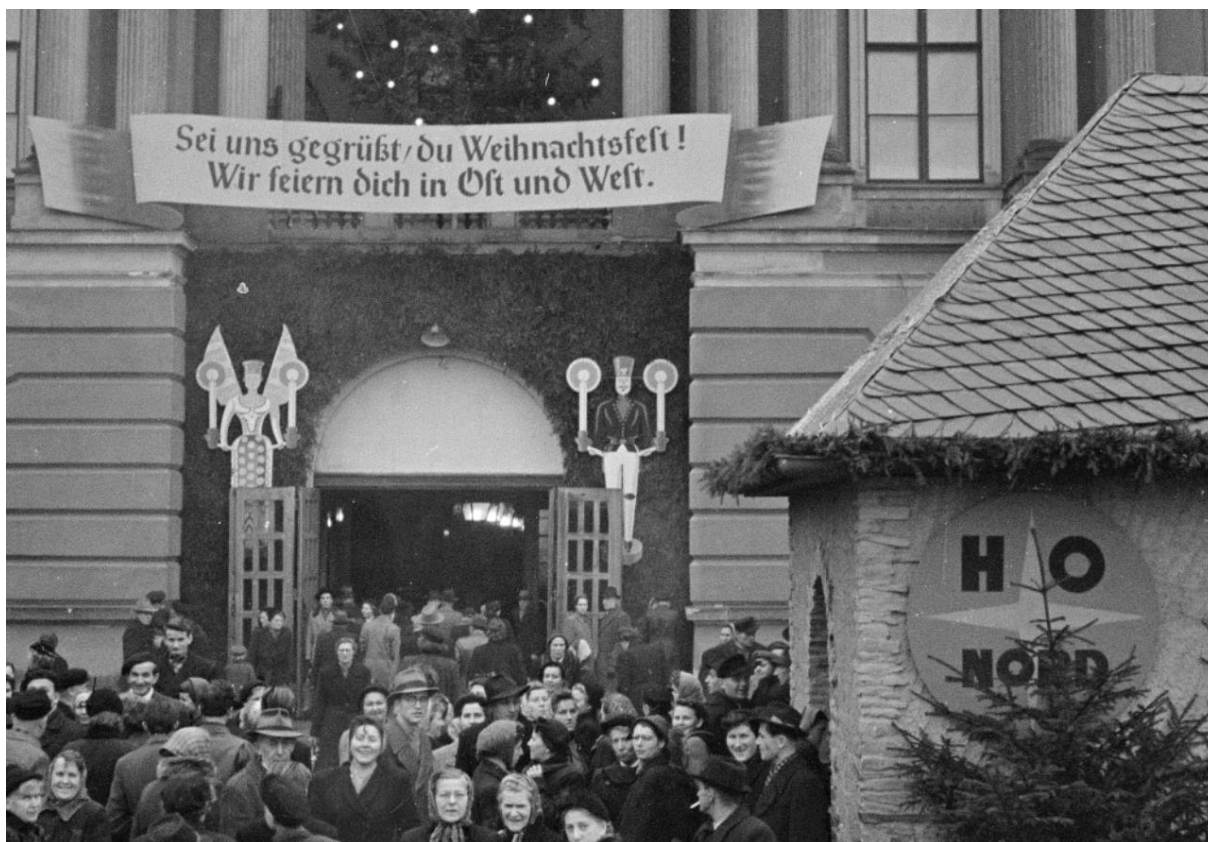
Striezelmarkt auf dem Theaterplatz 1954

Aus den reichen Beständen von Weihnachtsfotos habe ich Ihnen eine Fotografie aus dem Jahr 1954 herausgesucht. Damals fand der erste Striezelmarkt nach dem Krieg auf dem Theaterplatz statt: