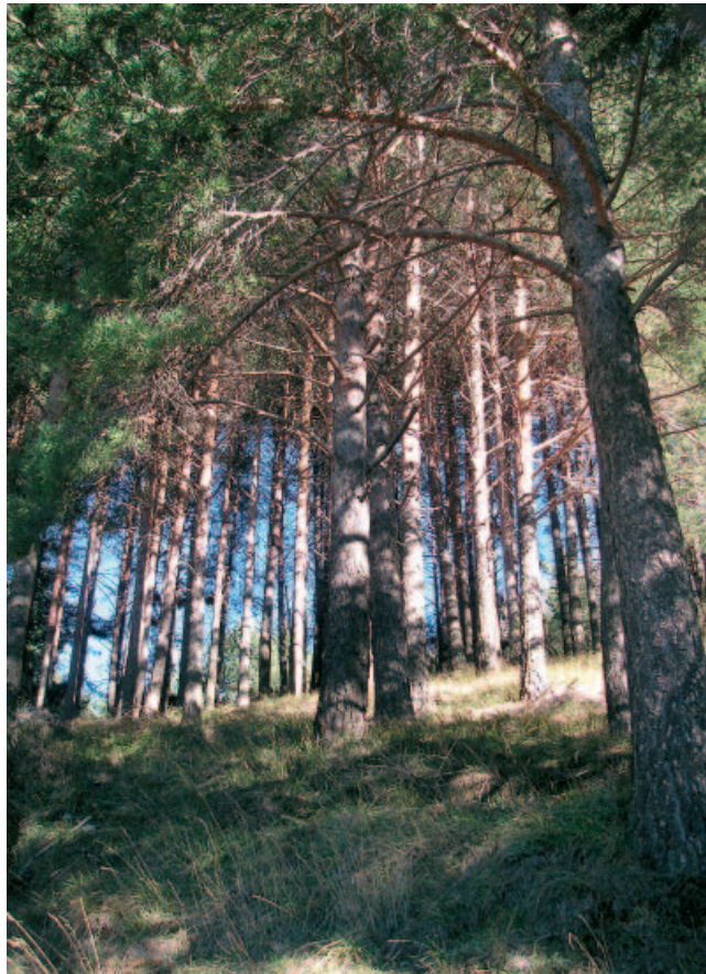
Esbeltos pinos silvestres en el interior del pinar de Velilla.

El itinerario recorre este bosque centenario describiendo un recorrido en forma de lazo. El inicio se ubica en un aparcamiento situado en la carretera que nos conduce al pueblo semiabandonado de Valcobero. Para llegar hasta allí, cogeremos la carretera P-210 desde Velilla del Río Carrión, y a unos 2 km. veremos el desvío que nos conduce a mano derecha entre chopos de gran porte y las edificaciones de lo que fue el antiguo poblado de la presa de Compuerto, a la explanada habilitada como aparcamiento y principio de la ruta.