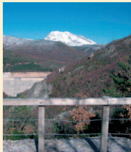
4. Vista desde el mirador de Compuerto, con el pico Espígüete al fondo.