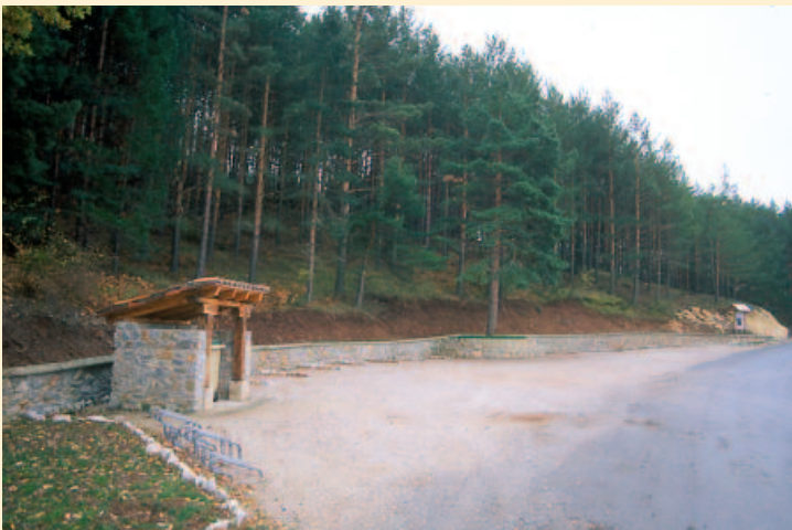
2. Aparcamiento e inicio de senda.