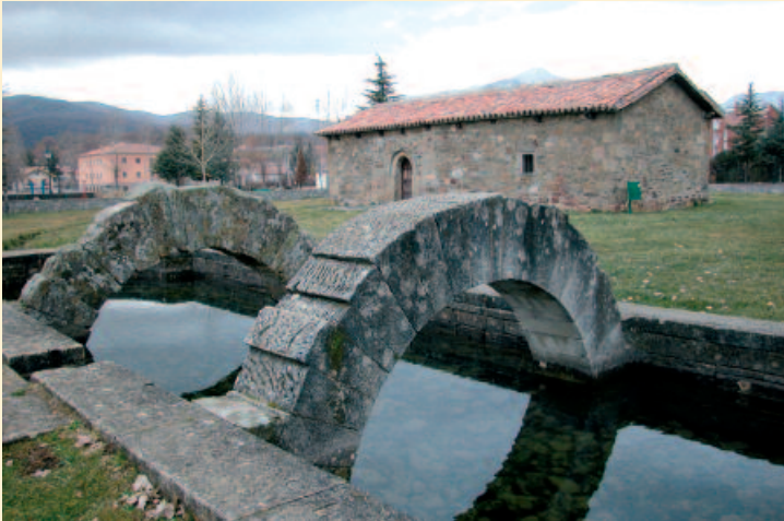
1. Fuente vauclusiana denominada La Reana en Velilla del Río Carrión.