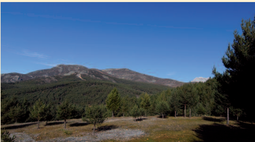
3. Vista del pinar desde las ruinas de la cantera.