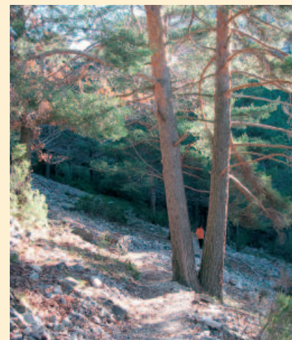
5. La senda atravesando el pinar.