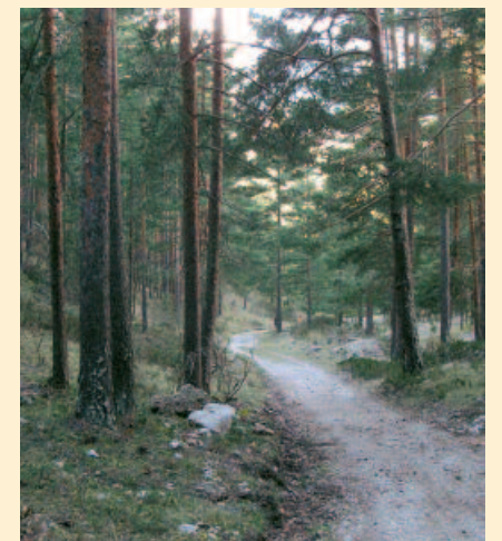
6. Pinar en el entorno del camino.