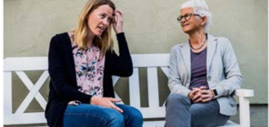
Tilflytting – Det er viktig at unge som flytter, får tilflyttingstjenester som barnevern og BUP. De skal nå avtales med barnevern og BUP i Trøndelag.