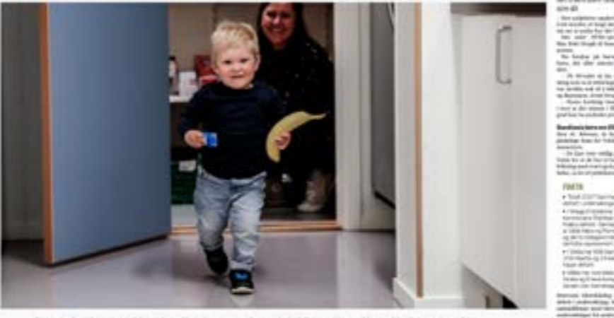
Barnevern – Det er viktig at unge som flytter, får tilflyttingstjenester som barnevern og BUP. De skal nå avtales med barnevern og BUP i Trøndelag.

En trygg barnehage med god kvalitet kan fremme psykisk helse hos barn og unge, mener forskere. Nå skal de finne ut hvordan de skal oppnå bedre kvalitet for de minste barna.