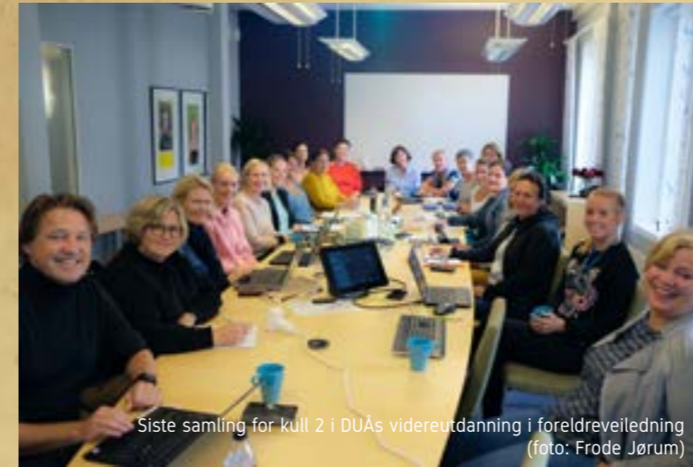
Siste samling for kull 2 i DUAs videreutdanning i foreldreveiledning

I tillegg til disse faste foraene er vi med i mange ulike nettverk innen våre to hovedarbeidsområder psykiske helse for barn og unge og barnevern. I hovedsak nettverk som er regionalt forankret i Midt-Norge.