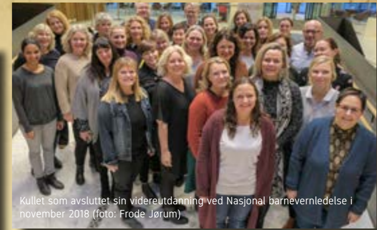
Kullet som avsluttet sin videreutdanning ved Nasjonal barnevernledelse i november 2018