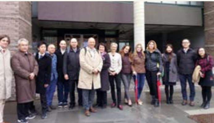
Deltakere under PBL-workshopen.