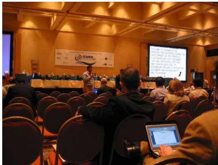
(パブリックフォーラム)