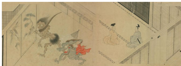
『百鬼夜行絵巻』 [江戸中期] 写