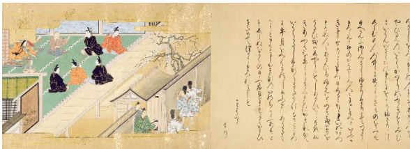
『竹とり物語』 [江戸前期] 写