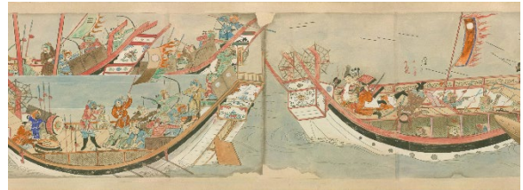
『蒙古襲来合戦絵巻』 書写年不明