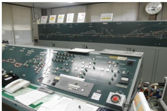
●CTC センター内の状況

CTC センターには全線の信号やポイントの動作、全列車の位置と進行方向などの運行に関する情報が一目で確認できる表示盤と各駅の信号やポイントを遠隔操作する制御盤が設置され、更なる運行管理の効率化及び迅速化、旅客サービスの運転保安度の向上を目指し取り組んでいます。