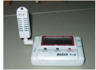
自動温湿度記録装置・データロガー

カビは劣悪な環境では48時間で発生すると言われています。以前行った実験の環境では1週間程度で発生しました。また、日本の気候環境のなかで完全にカビが発生しない環境を作り出すことは、コスト面など現実的には困難な場合が多くあります。日常的な温湿度の点検と同時に、カビを監視し、発見したらすばやく対処することで、被害を最小限に抑えることも重要です。