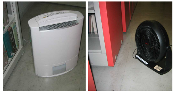
除湿機とサーキュレーター

十分な栄養があれば、好乾性のカビによっては相対湿度60～65%で発生する可能性があるといわれています。温度や湿度を測定している場所は条件がよくても、書庫の中には空気が澱んだり、時には結露まで起こしている場所があるかもしれません。環境改善のための施設改善はいずれも高額な費用がかかることもあり簡単にはいきませんが、それも視野に入れながら「当面の」対策を考える必要があります。