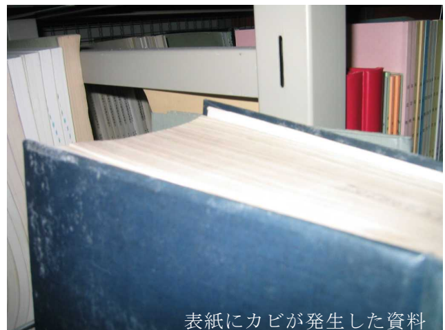
表紙にカビが発生した資料

活性化しているカビは少しの刺激でも胞子を撒き散らします。他の資料への感染を避けるためにも、まずはカビの発生した資料を静かにビニール袋等に入れ、別室に移動させます。移動先の部屋では HEPA あるいは ULPA フィルター付きの空気清浄機を作動させ、カビの除去作業を行います。HEPA あるいは ULPA フィルター付きの空気清浄機や掃除機がない場合は屋外での作業も考えられます。資料の移動が現実的ではない場合は、拡大を抑制するためにエタノールで直ちに処置します。