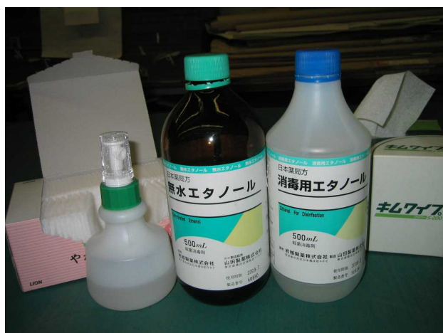
無水エタノールと消毒用エタノール

無水エタノール、消毒用エタノールは薬局で購入できます。500mlで1500円程度です。