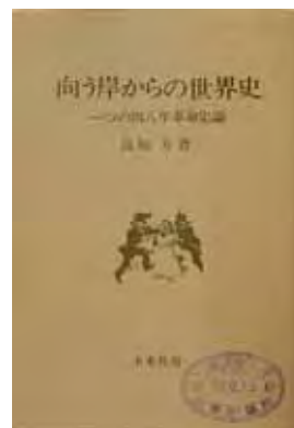
良知力『向う岸からの世界史』（1978）