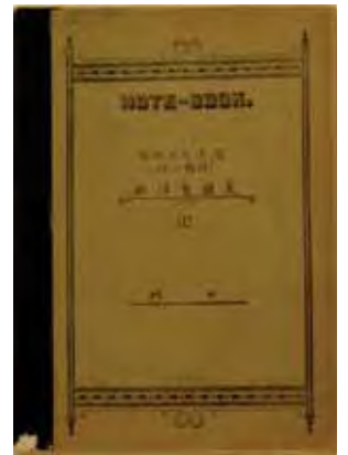
増田四郎「西洋史講義」手稿

連綿と続く一橋大学の学問的伝統と「新しい歴史学」のあいだには、そもそも融和的な関係がいくつか認められる。『一橋の学風とその系譜 2』（1985）に収録された「一橋歴史学の流れ」（1982）で増田四郎は、高等商業学校時代の中期にあたる 1895 年ごろに、これの原型が形成されたとし、その特徴を「政治史中心だとか、皇国史観だとか、国家の制度だとかそういうものではなしに、庶民生活に即した商業史、工業史」に見ている。増田自身も地域史の提唱者であった。このように、一橋大学の歴史学の伝統は、「新しい歴史学」と同じく、歴史学を狭く政治史に限定しない傾向を備えていたのである。また、本学で教鞭を執った三浦新七（1877-1947）やその弟子の上原専禄に共通する、世界的・全体史的志向も忘れてはならないだろう。