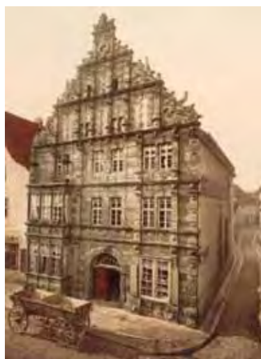
鼠捕り男の家と舞樂禁制通り (1898 年頃)

既存の歴史概念では捉えきれず、従来の歴史学の方法では再構成できない過去の世界、そこに生きた人々の「思考世界」に阿部は惹きつけられ、何とかしてこれに近づきたいと思う。今では歴史的事件の英雄たちに隠れてしまったその他大勢の民衆の姿、注意深く耳を傾けなければ聞こえてこない、かき消された民衆の声を掘り起こし再構成する歴史学に、彼は向かっていた。阿部は笛吹き男の研究を、自身の研究生活のなかにおける「小さな花」と呼び、何かしら特別な思いを抱いていたようであった。