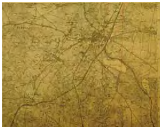
東プロイセン州の地図 (1912)