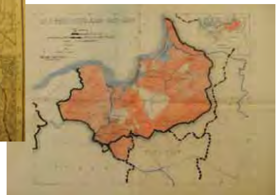
プロイセン (1310－1466) の地図