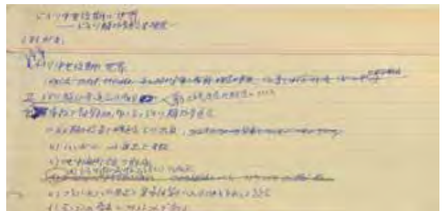
手稿：Die Komturei Osterode (左) 『ドイツ中世後期の世界』(右)