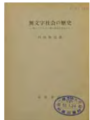
川田順造『無文字社会の歴史』（1976）