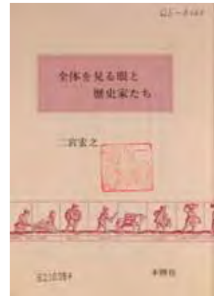
二宮宏之『全体を見る眼と歴史家たち』（1986）

文化人類学者の川田順造（1934-）もまた、従来の歴史学に対し、深刻な疑問を呈したひとりである。彼の『無文字社会の歴史』（1976）は、文字資料を偏重して人間や社会を研究してきた者すべてにとって、大きな衝撃であった。なるほど、文字による過去の記述だけが「歴史」と認められるならば、未だかつて文字を持たなかった者たちは、いっさいの歴史を持たないことになってしまう。必ずしも文字によらずとも、伝承や遺物によってとどめられた人間の生および社会の形態が存在し、それらを再構成する試みは無駄な営為ではないはずだという強い思いが、川田を突き動かしていた。