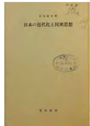
安丸良夫『日本の近代化と民衆思想』 (1974)

対して安丸良夫（日本思想史）は、「理念化された近代思想像に固執してそこから歴史的对象を裁断するモダニズムのドグマ」に批判的であった。そのようなドグマに陥った視点からは、支配者たちの思想は見えてきても民衆については困難で、明らかにされる場合でも、ネガティブな評価の圧倒的なためである。しかし彼にとって、歴史を突き動かす根源的な力は民衆の側にある。そこで安丸は『日本の近代化と民衆思想』（1974）の目的を、「民衆の生き方・意識の仕方」を通して、日本の近代化過程の意味を考えなおすことに求め、従来の「近代化論」や「国家主義的歴史観」に根底から見直しを迫った。この点で、阿部や網野の社会史にも深い理解を示したといえる。