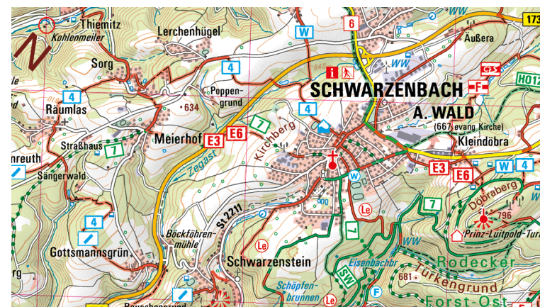
Ausschnitt aus UK50-4 Naturpark Frankenwald

Der Frankenwald bietet vielfältige Entdeckungsmöglichkeiten abseits des Massentourismus im Herzen Deutschlands. Familien verbringen einen schönen Tag in der Bergbau-Erlebniswelt Kupferberg oder im Tiergarten Sonneberg. Unvergessliche Erinnerungen sammelt man auf einer Floßfahrt auf der wilden Rodach in Wallenfels. Badespaß bieten das Erlebnisbad Crana Mare in Kronach oder die Thermo Bad Steben.