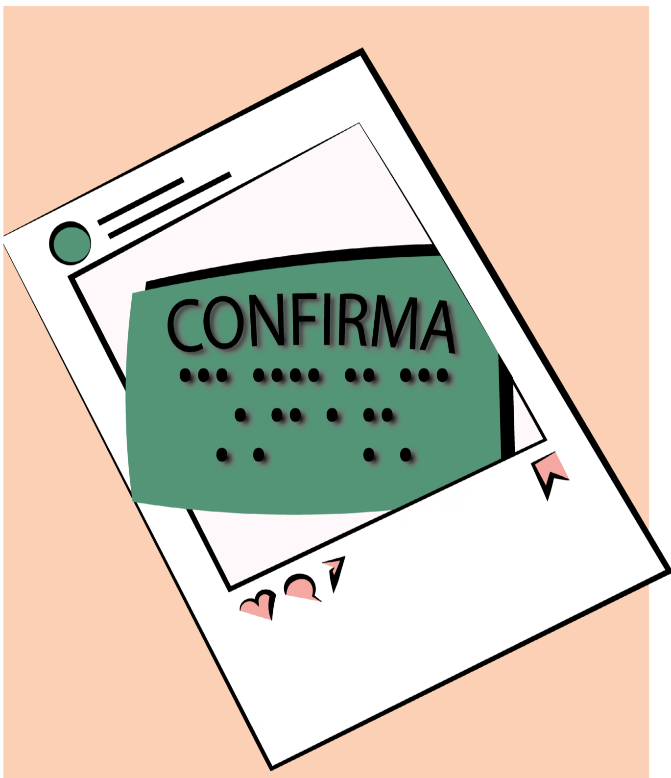
Ilustração: Renato Carvalho/TSE