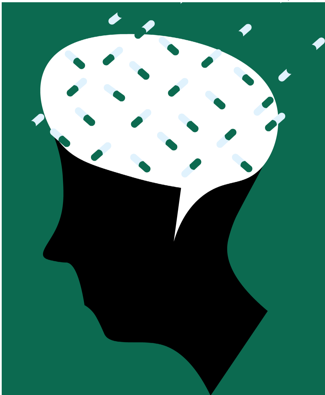
Ilustração: Renato Carvalho/TSE