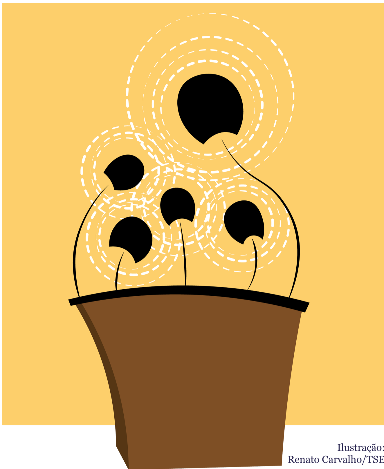
Ilustração: Renato Carvalho/TSE