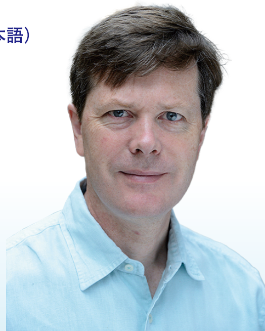
第39回 国際生物学賞受賞者 ケンブリッジ大学遺伝学部門 アル・キンディー教授 リチャード・ダービン博士

国際生物学賞は、昭和天皇の御在位60年と長年にわたる生物学の御研究を記念するとともに、本賞の発展に寄与されている上皇陛下の長年にわたる魚類分類学の御研究を併せて記念し、生物学の奨励を目的とした賞です。本賞は昭和60年に創設され、以後毎年1回、生物学の授賞分野を選定の上、当該分野の研究において優れた業績を挙げ、世界の学術の進歩に大きな貢献をした研究者を選考して授賞しています。