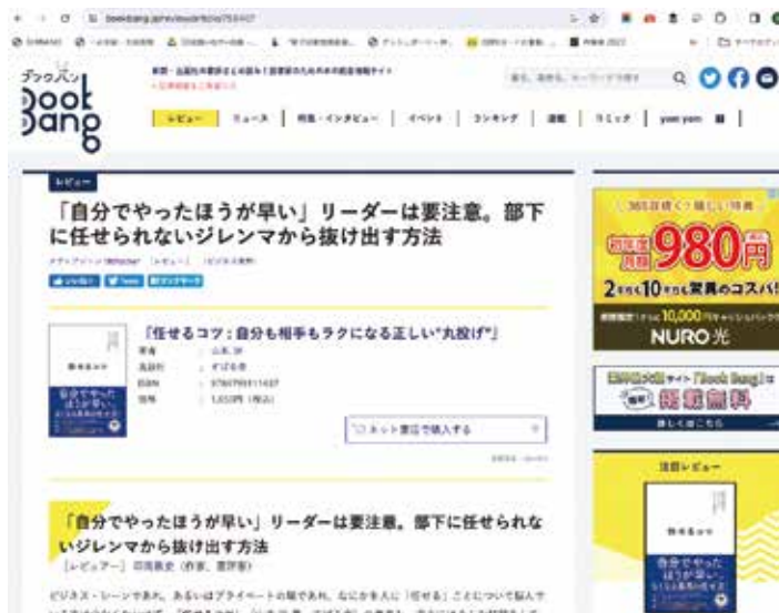
▼図⑥ 書評まとめ読みサービス 新聞雑誌などの書評をまとめて読めるサービスを提供。紹介の際には書誌・書影はかかせない。