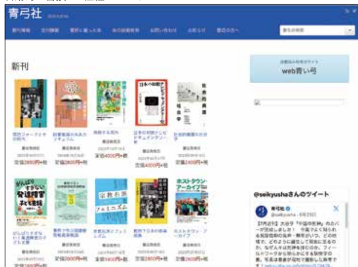
▼図⑦ 出版社 再利用承諾をしてもらえば、版元ドットコム→openBD APIを経由して、自社サイトの更新を自動的に書換える仕組みがつけられる