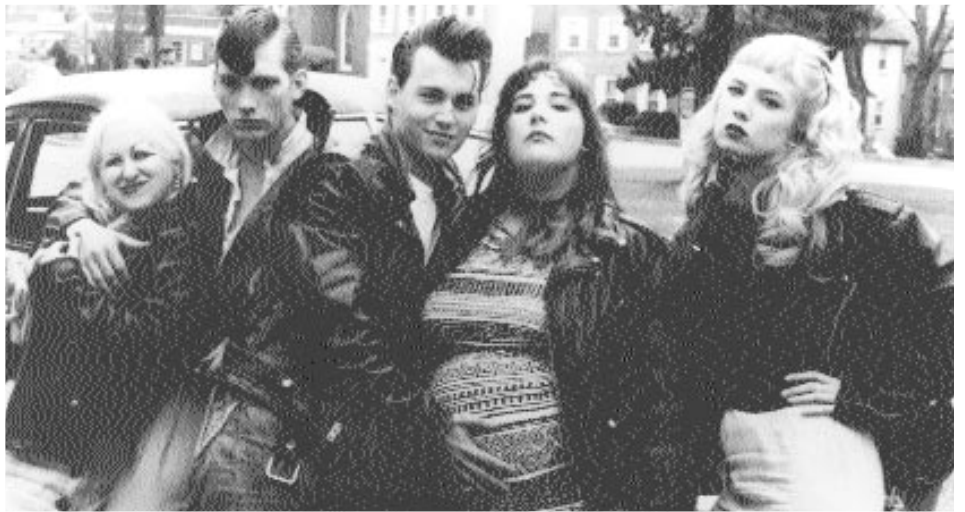
Hatchet-Face, Milton, Cry-Baby, Pepper och Wanda är med i gänget The Drapes.

Hon söker nya utmaningar i livet och skulle gärna vilja bli en "dålig" flicka i Cry-Babys armar. För att utforska dessa okända sidor hos sig själv närmar hon sig Cry-Babys gäng till Baldwins och kompisarnas stora förskräckelse. För Cry-Baby är Allison en uppenbarelse från en annan värld. En prinsessa, som han måste göra allt för att erövra. Cry-Babys farlighet, den upphetsande musiken och alla nyväckta hormoner får Allison att snabbt överge Baldwin. Att den fina överklassflickan väljer en sån som Cry-Baby sätter hela omvärlden i gungning och inte minst Baldwin som gör allt för att hämnas. Tillsammans med sitt gäng startar han ett bråk som