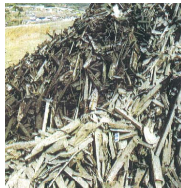
水槽分離された木くず