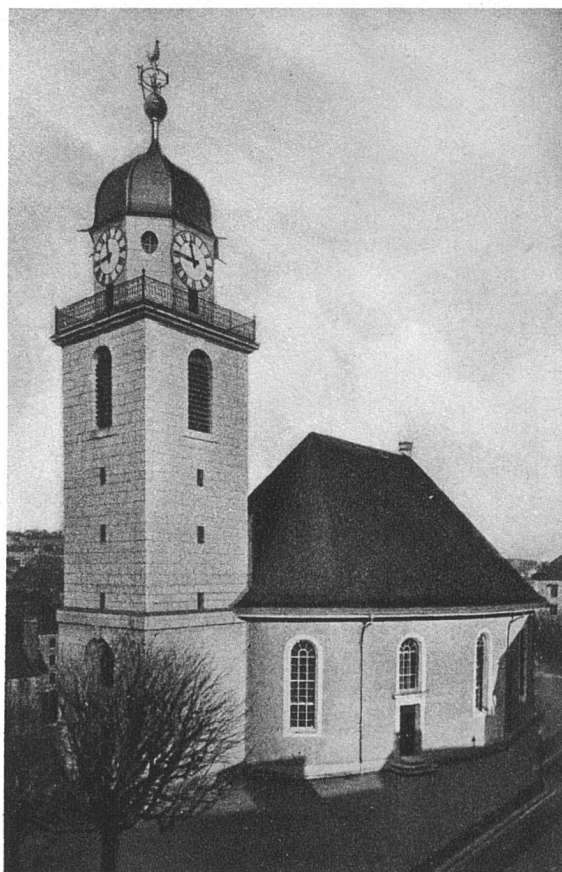
LE GRAND TEMPLE DE LA CHAUX-DE-FONDS / RÉÉDIFIÉ APRÈS L'INCENDIE DE 1919 PAR CHAPALLAZ ET EMERY, ARCHITECTES