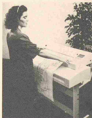
Der «Megafax» übermittelt Formate bis A1

Der Megafax verfügt über einen Fine-Auflösungsmodus, einen Fehler-Report und 16 Grautöne. Somit eignet sich das Gerät auch für die Übermittlung von Illustrationen. Eine 100-Meter-Papierrolle und ein Kurzwahlspeicher für 90 Telefonnummern komplettieren diesen Telefax. Zeitverzögerte Übermittlungen, Übertragungsgeschwindigkeit 9600 bps, automatische Wahl des besten Übertragungsmodus je nach Leitungsqualität, die