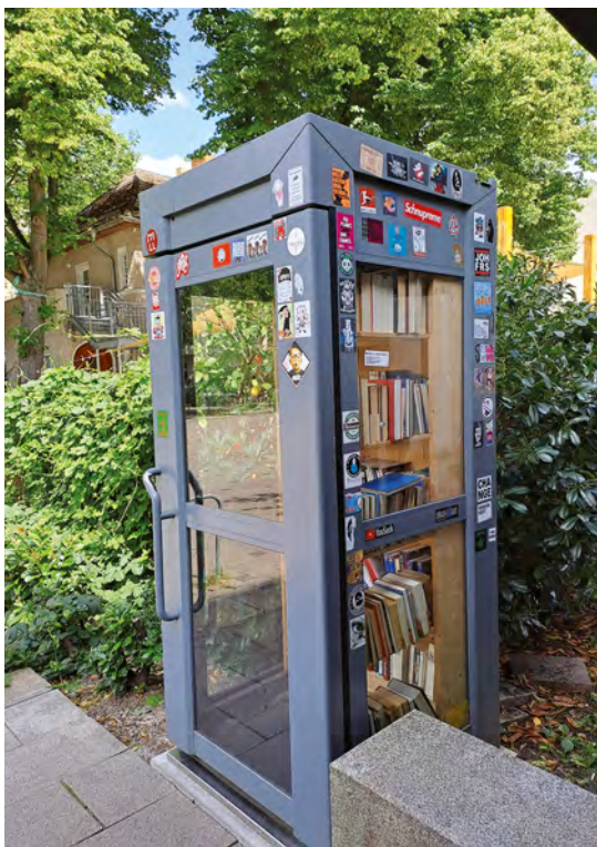
Abbildung E.1: Tauschbox in Berlin

Im Bereich des Wohnens spielt Sharing unter Anderem in sogenannten Cluster-Wohnungen eine wichtige Rolle. Grundrisse von Cluster-Wohnungen sehen vor, dass mehrere kleinere private Wohneinheiten durch einen größeren Gemeinschaftsbereich ergänzt werden. So kann z.B. neben kleinen Küchen in den einzelnen Wohneinheiten eine größere, besser ausgestattete Küche inklusive gemeinschaftlich nutzbarer Aufenthaltsräume für alle Bewohner*innen bereitgestellt werden. Hierdurch besteht eine klarere Trennung zwischen