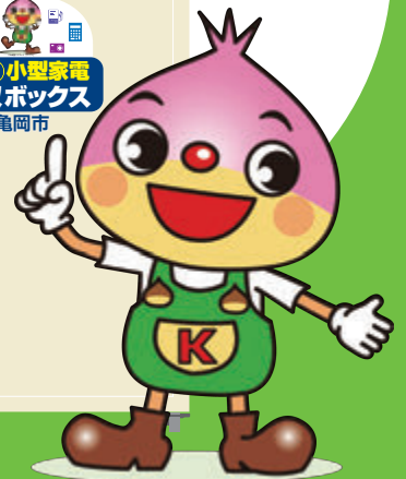
ごみ減量マスコット「クリーン」