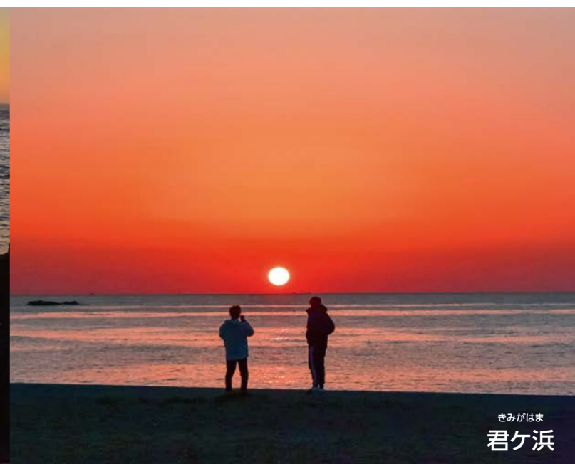
きみがはま 君ヶ浜

元日は、初日の出においてになる自動車でも相当混雑するため、犬吠埼周辺にて交通規制を行います。