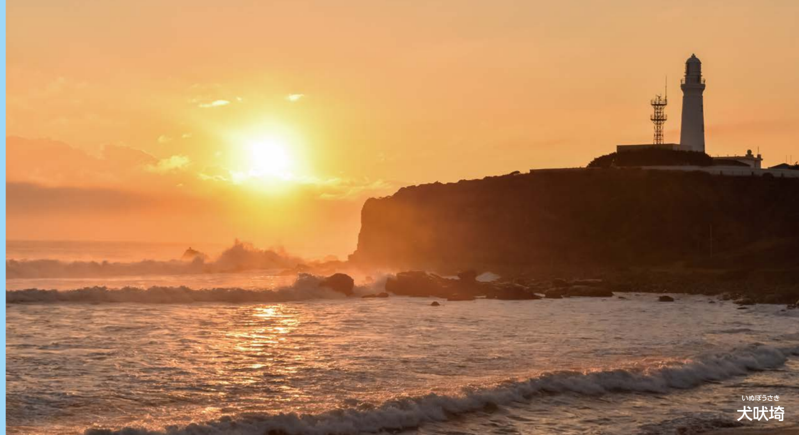
いぬぼうさき 犬吠埼