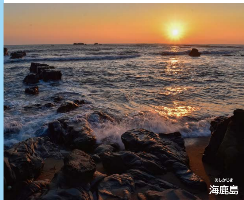
あしかしま 海鹿島