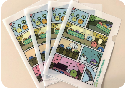
期日参加12回目でクリアファイル！

いつも裁判期日に東京地裁にお越しいただきありがとうございます。傍聴支援をしてくださる皆さまへ対し、期日参加6回ごとに、オリジナルグッズを差し上げています。長期にわたる裁判を、引き続き応援してください。