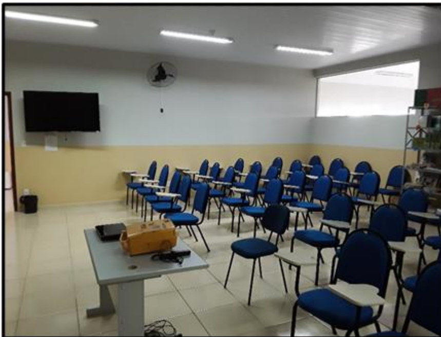
Foto: Laboratório de Informática FOTO DIURNA – ênfase na iluminação.