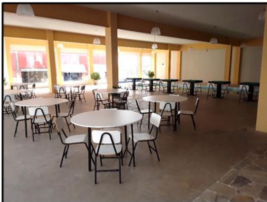
Foto: Acessibilidade do polo.