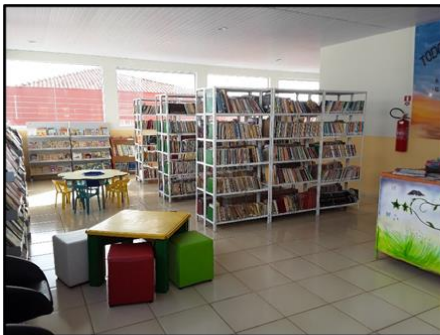
Foto Sala de tutoria.