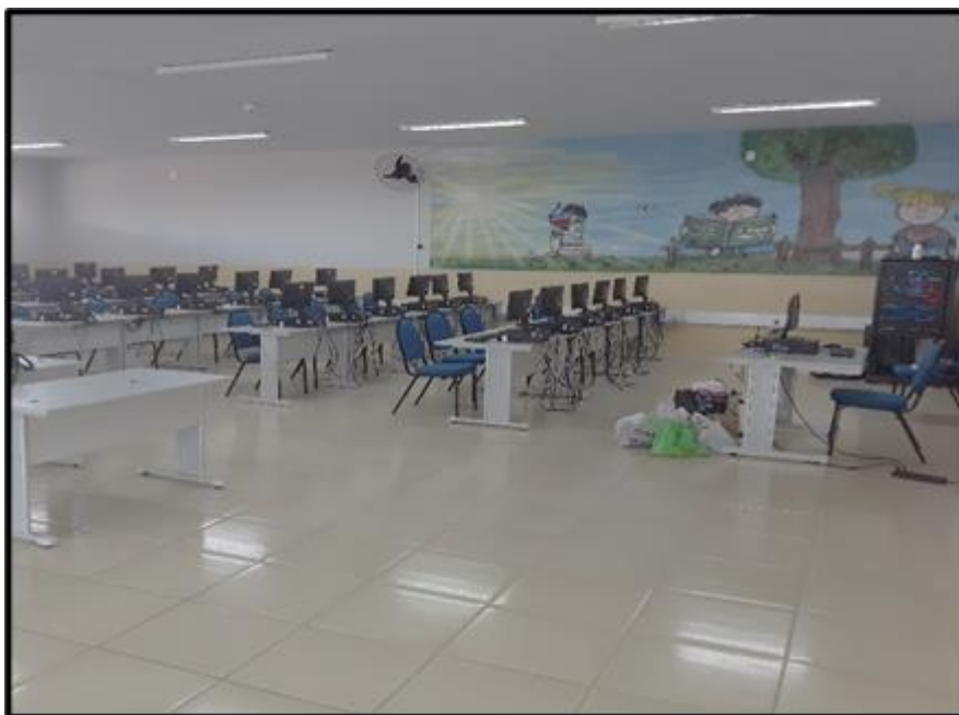
Foto: Sala de estudo em grupo.