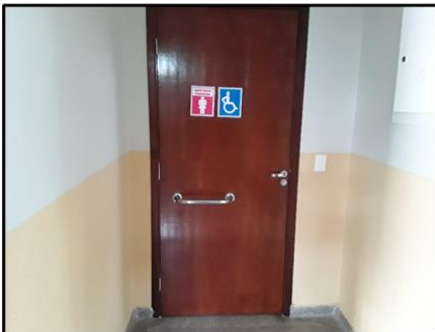
Foto: Acessibilidade do polo.