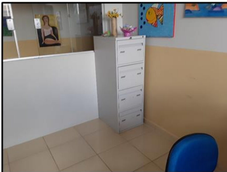
Foto: Sala de aula.