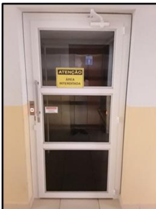
Foto: Acessibilidade do polo.