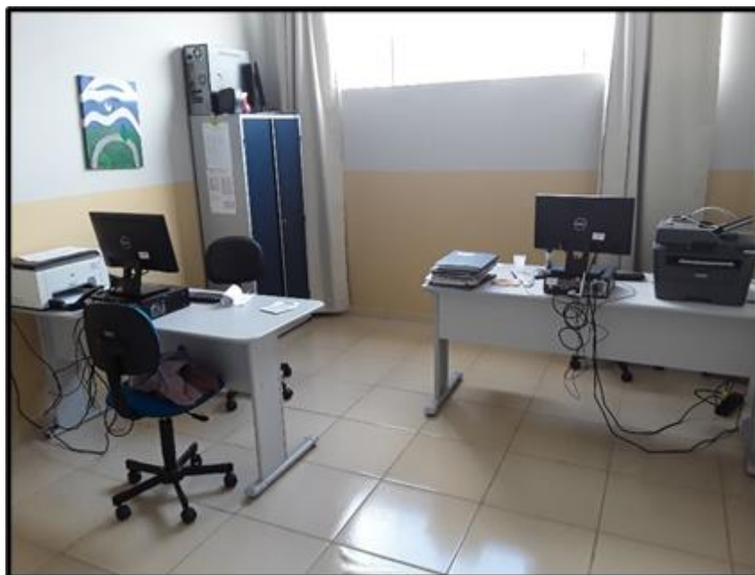
Foto: Recursos tecnológicos do polo.