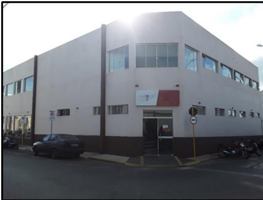
Foto: Rampa de acessibilidade de acesso ao polo.

Foto: Fachada do edifício onde será fixada placa com identidade visual da UNIVESP.