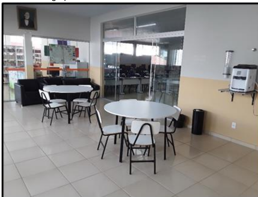
Foto: Espaço da Biblioteca/Brinquedoteca/Laboratório.