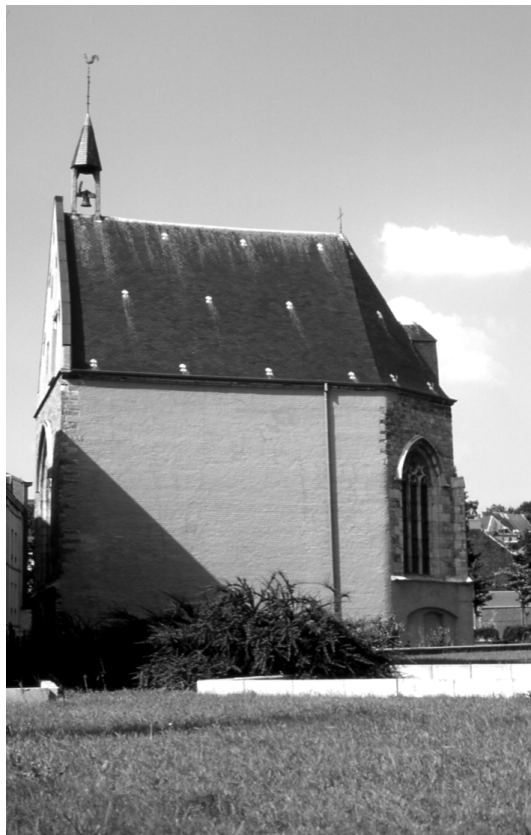
Abbildung 7 (Mons, K5) Kapelle des ehemaligen Beginenhof von Mons.