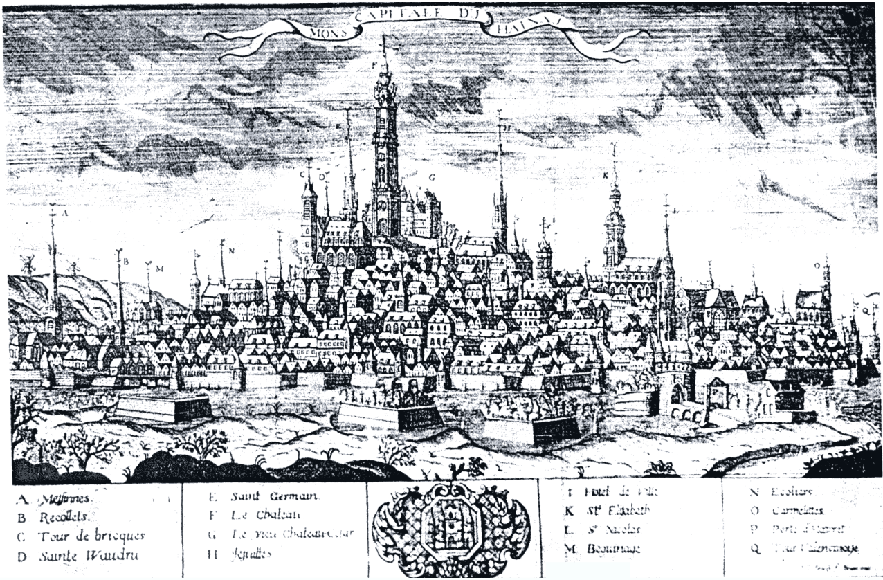
Abbildung 3 (Mons, K5) Vedute von Mons im 18. Jh., Hauptstadt der Grafschaft Hennegau. Die Kirche des Beginenhof von Mons ist mit M bezeichnet, aus: Gutkind, E. A.: Urban Development in Western Europe: France and Belgium, International History of City Development, Volume V, New York/London 1970, S. 445.