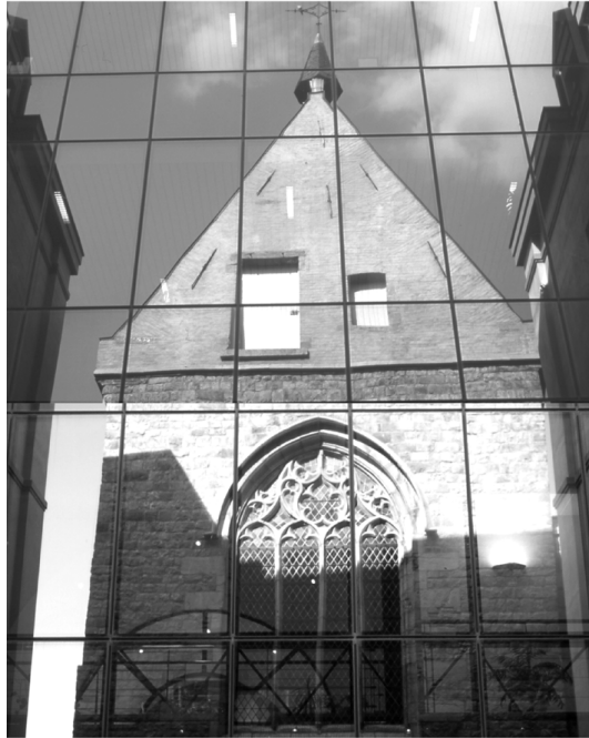
Abbildung 6 (Mons, K5) Kapelle des ehemaligen Beginenhof von Mons, vom Hospitalgebäude aus gesehen.