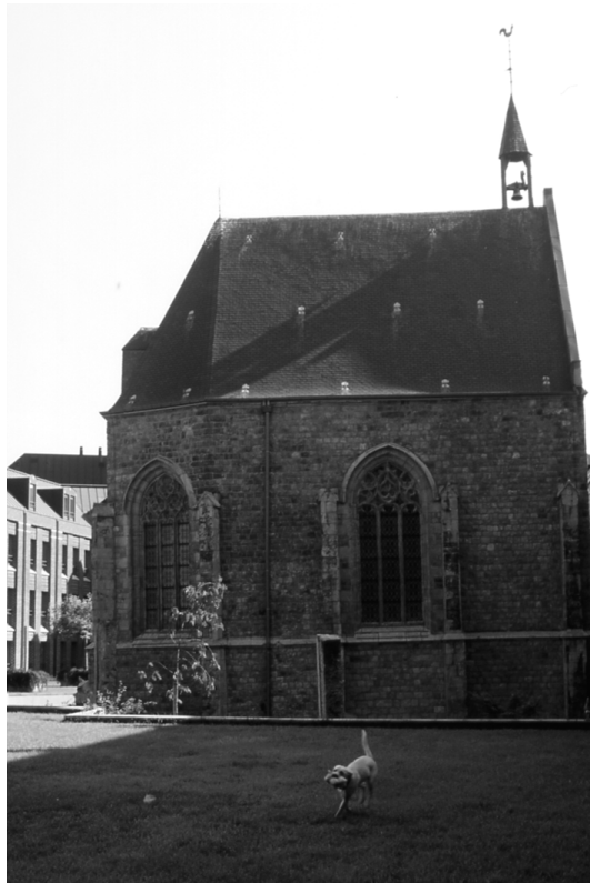
Abbildung 5 (Mons, K5) Kapelle des ehemaligen Beginenhof von Mons, direkt hinter dem ehemaligen Hospitalgebäude gelegen.