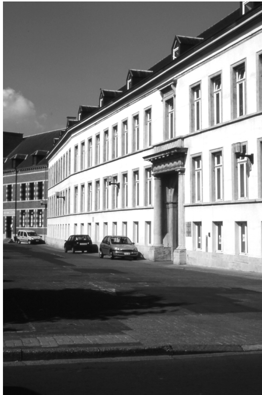
Abbildung 4 (Mons, K5) Das ehemalige Hospital, das auf dem Grund des ehemaligen Beginenhof von Mons errichtet wurde. Heute dient das Gebäude der Landesverwaltung.