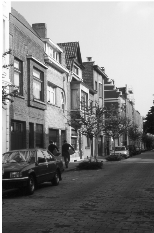
Abbildung 68 (Gent, K5) Gravin Johannastraat, Blick in Richtung Begijnhofdries, am Ende der Strasse ist das Groothuis (engerüstet) erkennbar. Im Vordergrund sind die im 20. Jh. auf Grundstücken des ehemaligen Begijnenhof Sint Elisabeth Gent gebauten Wohngebäude zu sehen.