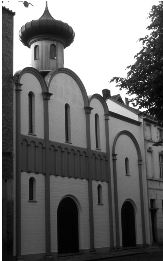
Abbildung 69 (Gent, K5) Im 20. Jh. erbaute Orthodoxe Kirche in der Gravin Johannastraat des Sint Elisabeth-Beginenhof in Gent.