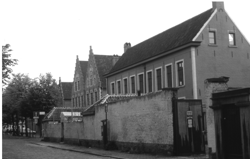
Abbildung 63 (Gent, K5) Blick von Sofie Van Akenstraat auf Gebäude Ecke Mathias Gesweinstraat, Sint Elisabeth-Begijnhof Gent.