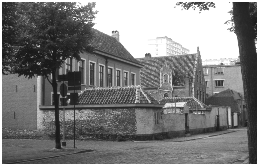
Abbildung 62 (Gent, K5) Blick von Begijnhofdries in die Sofie Van Akenstraat/Ecke Mathias Gesweinstraat, Sint Elisabeth Begijnhof Gent.