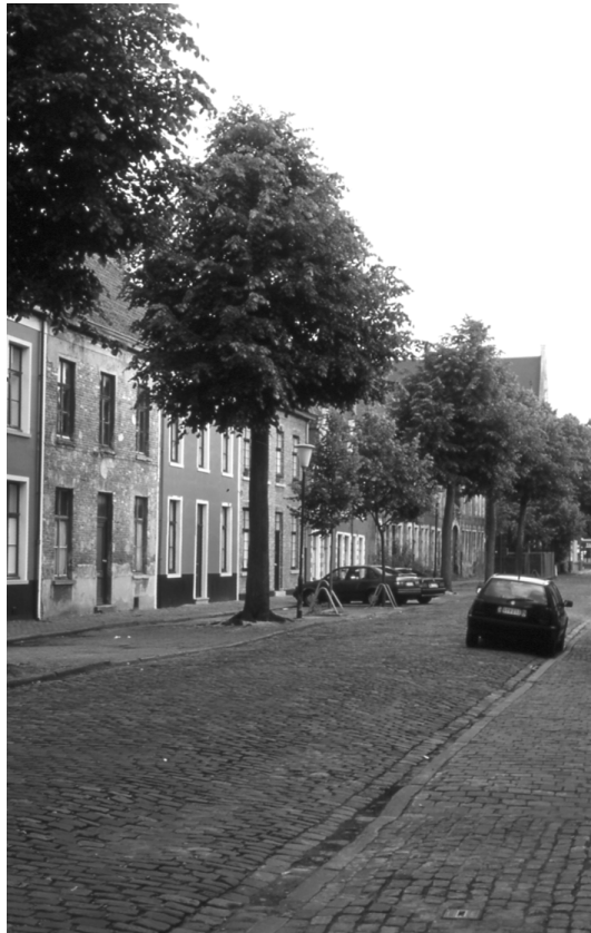
Abbildung 65 Ehemalige Beginenwohnhäuser in der Sofie Van Akenstraat. Blick in Richtung Begijnhofdries und Begijnhofkirche des Sint Elisabeth Begijnhof Gent.