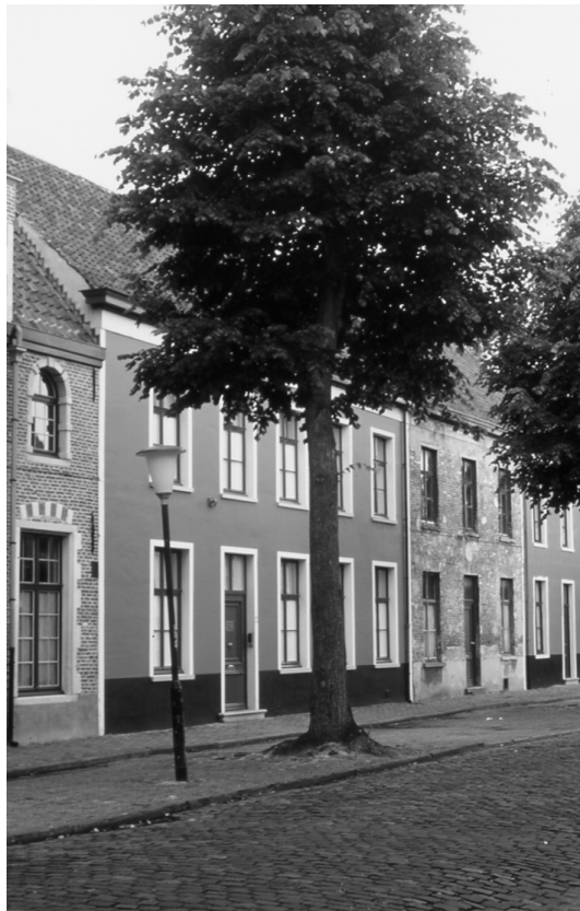
Abbildung 64 (Gent, K5) Häuser des ehemaligen Sint Elisabeth-Begijnenhof Gent in der Sofie Van Akenstraat.