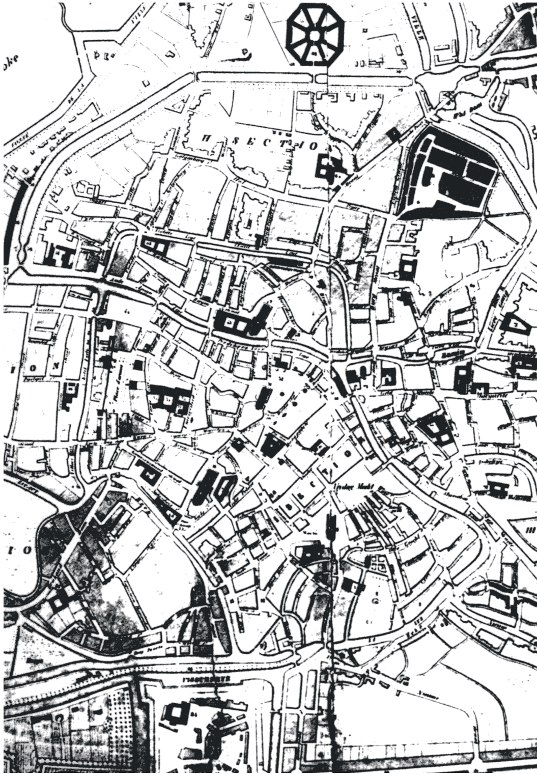
Abbildung 56 (Gent, K5) Ausschnitt aus dem Plan von Gent 1829. Rechts oben schwarz hervorgehoben der Sint Elisabeth-Beginenhof. Ebenso schwarz hervorgehoben sind öffentliche Gebäude der Stadt. Die Größe des Beginenhof im Verhältnis zur gesamten Stadt ist deutlich erkennbar, Detail aus "Plan routier de la ville de Gand, divisé en X sections, 1829", Quelle: Stadsarchief Gent Fototheek Gent Fototheek, L2/3.