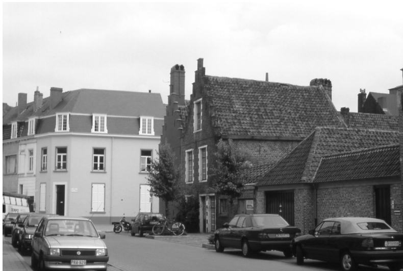
Abbildung 70 (Gent, K5) Jan Verspeyenstraat mit Blick auf Eingang zu Gravin Johannastraat, Sint Elisabeth-Beginenhof Gent.