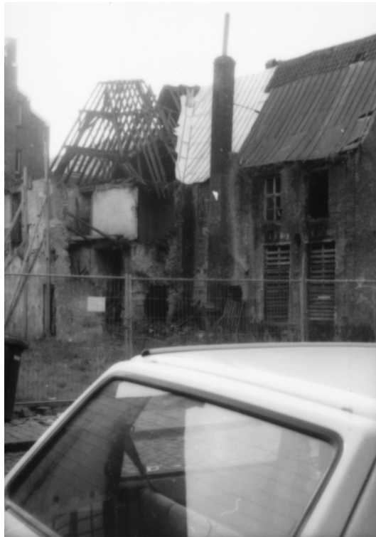
Abbildung 71 (Gent, K5) Der Zustand einiger Gebäude des ehemaligen Sint Elisabeth-Begijnenhof in Gent (etwa 1997).