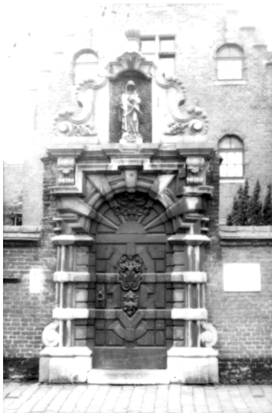
Abbildung 72 (Gent) Das Portal des Konvents St. Christinen im Sint Elisabeth-Begijnenhof in Gent.