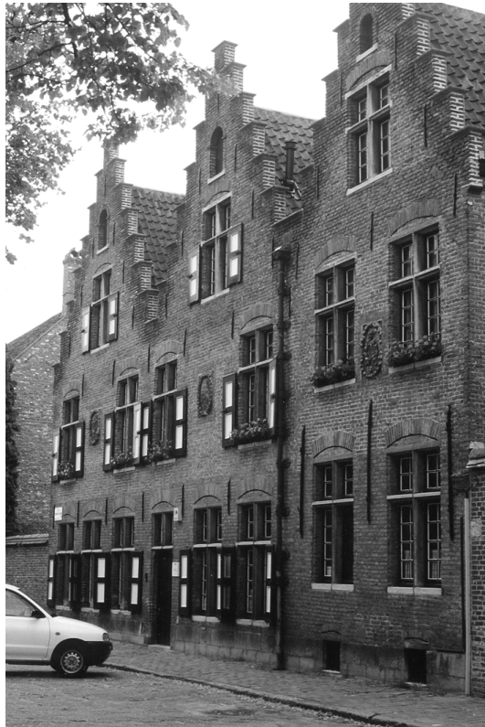
Abbildung 61 (Gent, K5) Restaurierte Gebäude des Sint Elisabeth-Beginenhof Gent am Begijnhofdries/Ecke Sofie Van Akenstraat.