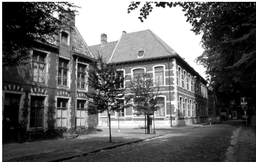
Abbildung 66 (Gent, K5) Blick vom Begijnhofdries auf Grootuis und Infirmierie sowie den Beginn der Gravin Johannastraat, Sint Elisabeth-Begijnhof Gent.