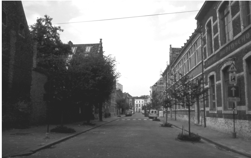
Abbildung 67 (Gent, K5) Blick in die Gravin Johannastraat, rechts ist das Groothuis erkennbar.