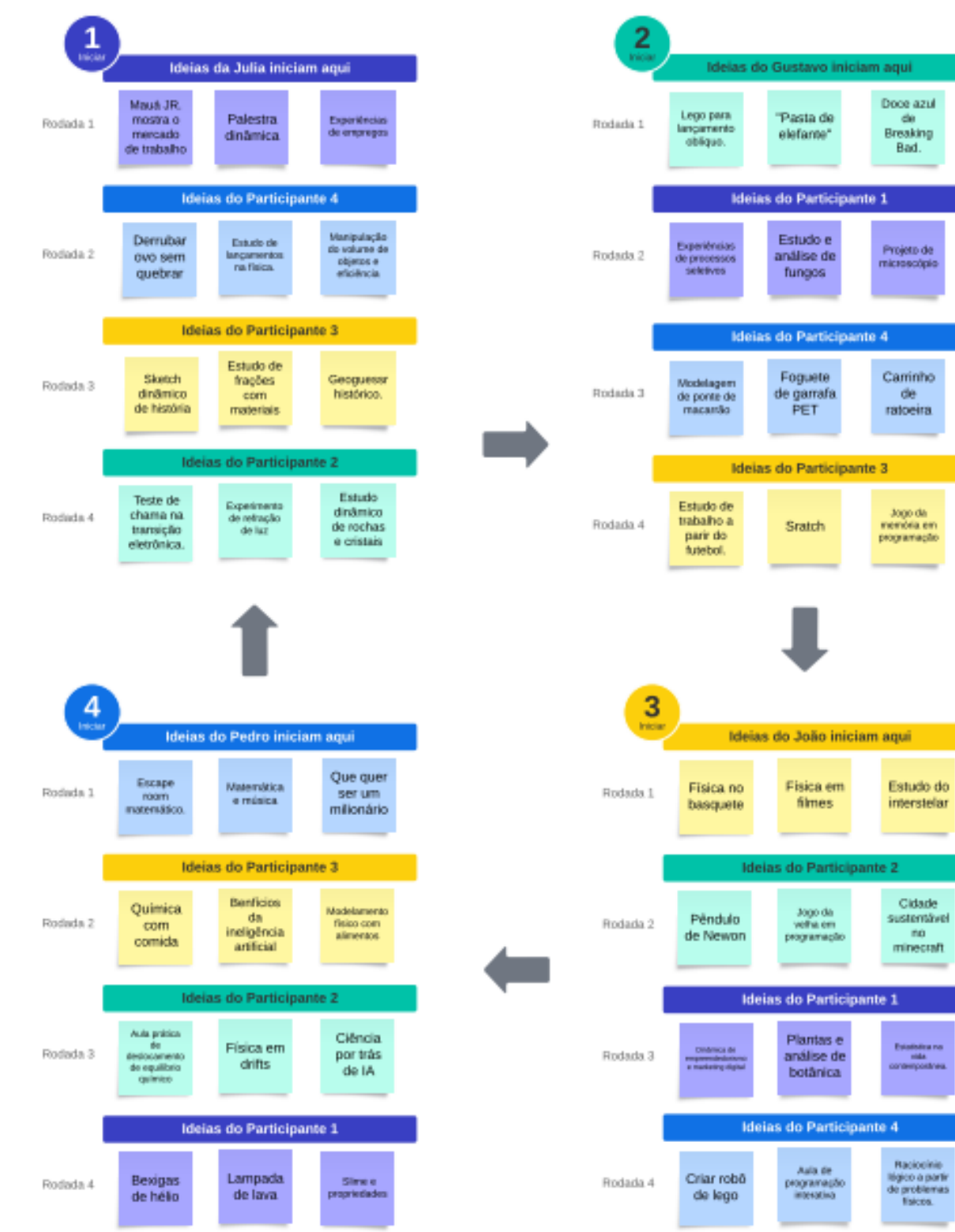
Figura 3 – Método de brainstorming 6-3-5

Direção-Geral da Educação - Aplicações para Dispositivos Móveis e Estratégias Inovadoras na Educação EAD PARA VOCÊ - Metodologia Escape Room Educativo: como elaborar?