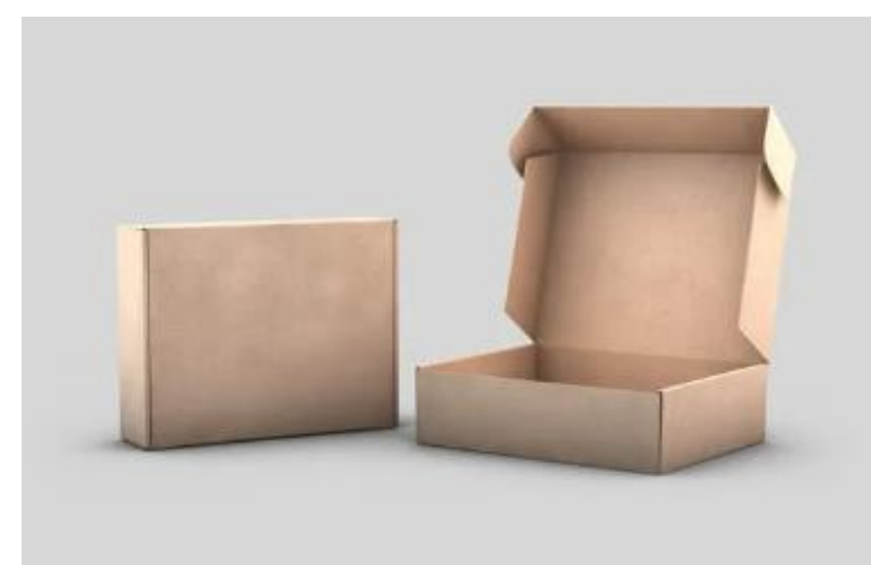
Figura 5 – Caixas