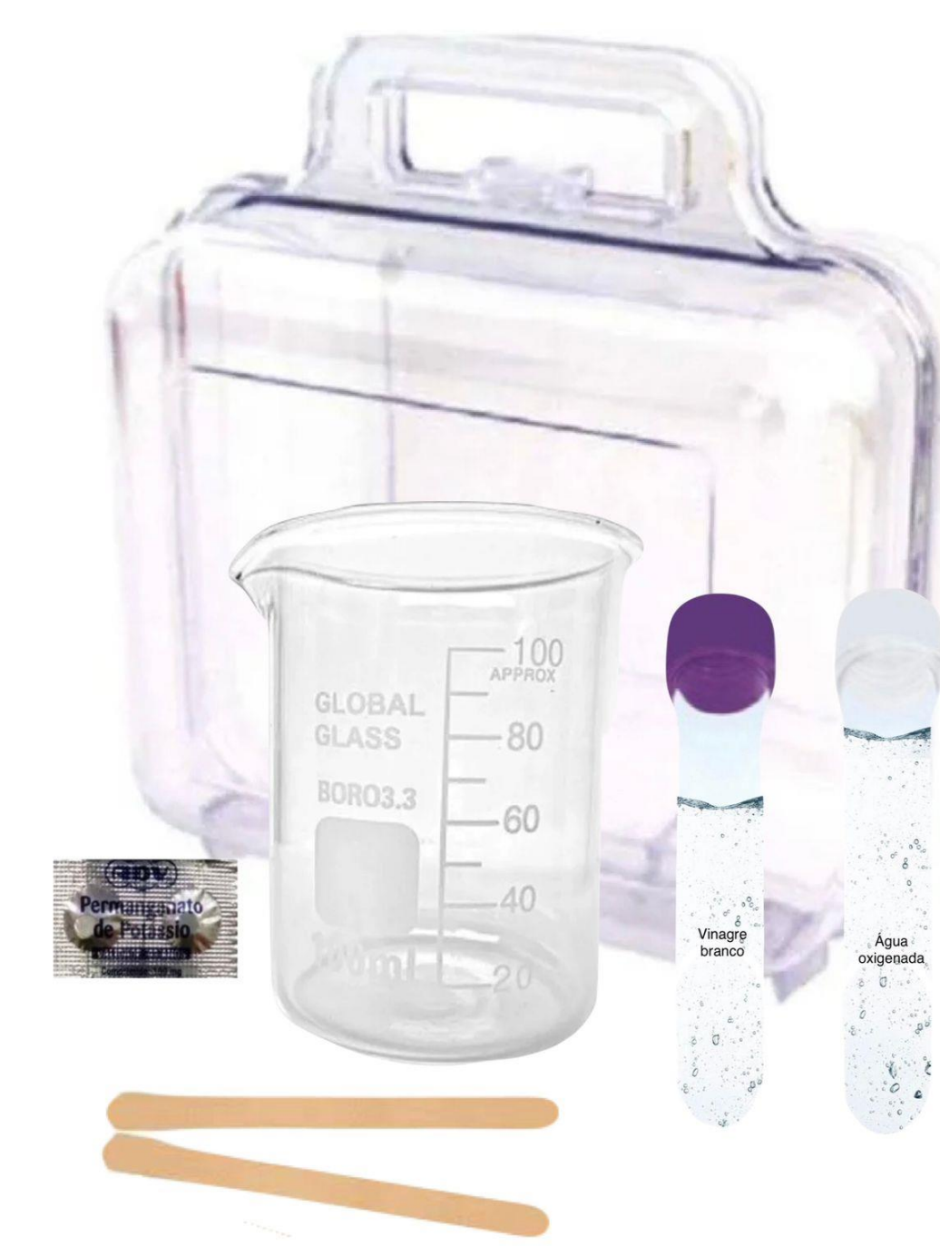
Figura 4 – Kit de laboratório completo.