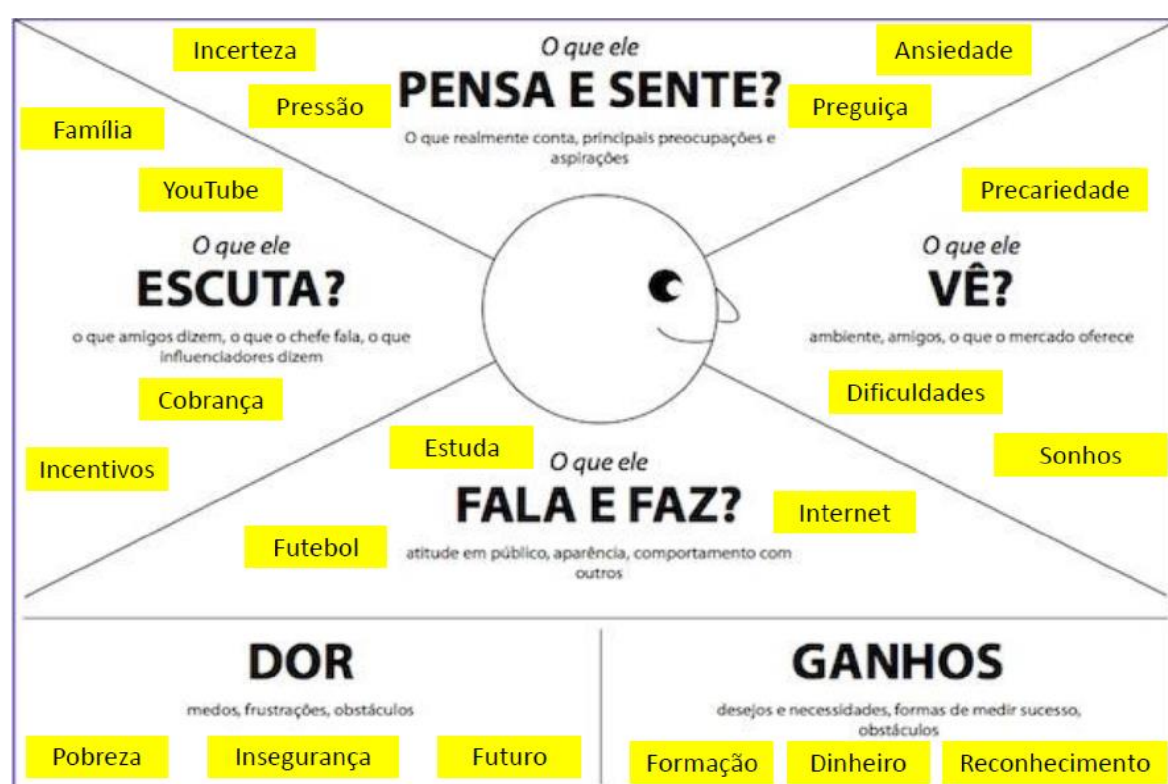
Figura 2 – Mapa de Empatia