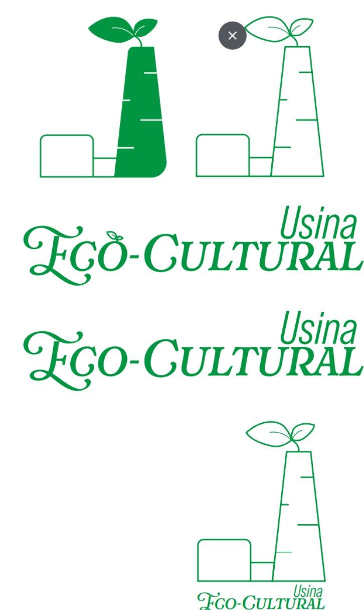
Figura 3 – Logo principal e variações

A prototipação do projeto se iniciou pelo desenvolvimento do logo (Figura 3), que traz elementos modernos mas que ainda remetem essência da Usina Eco-Cultural, e a partir dele criamos a identidade visual, e por fim, fizemos todos os elementos que compõe a proposta, como o merchandising como por exemplo: banners, panfletos, cartões de visita (Figura 4), visual de site, posts base prontos para as mídias sociais, camisetas (Figura 5) e bonés.