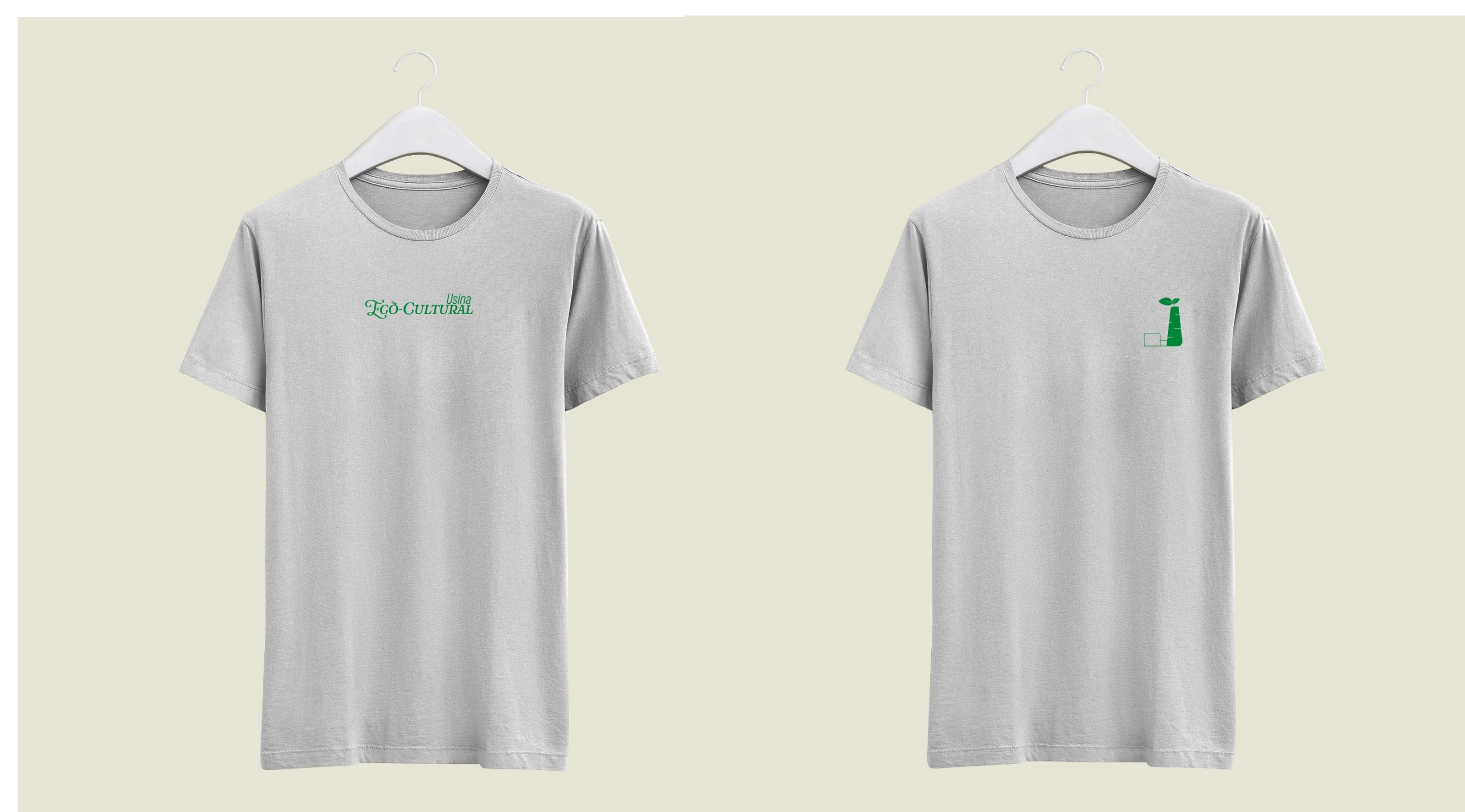
Figura 5 – Aplicação do logo em camisetas