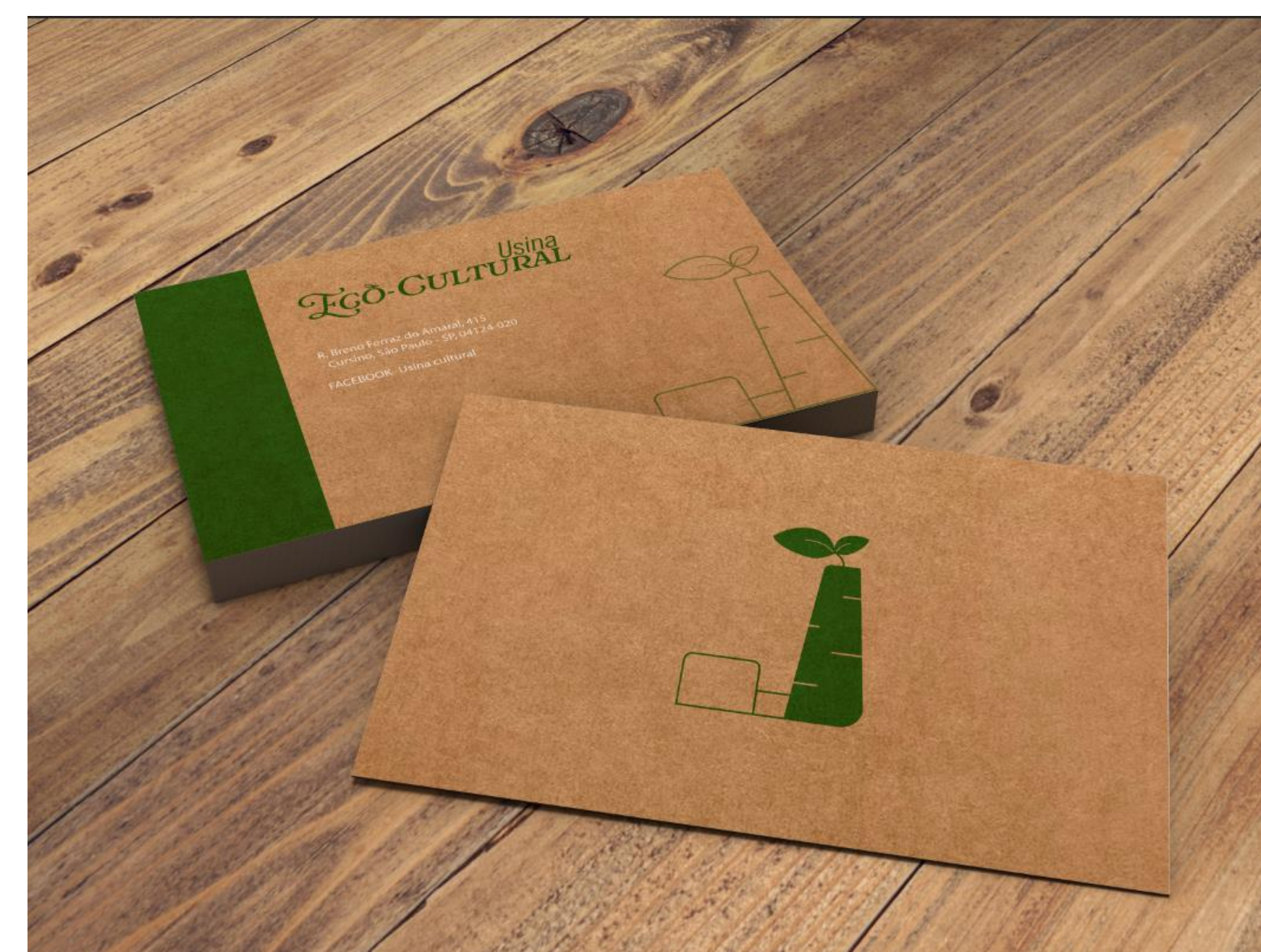
Figura 4 – Aplicação do logo em cartões de visita.