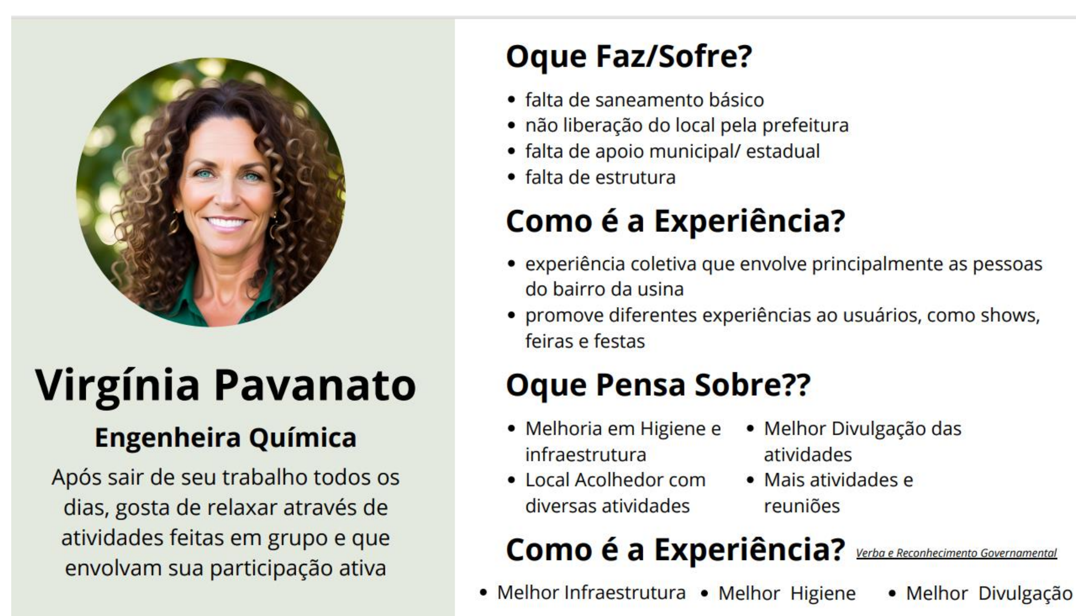
Figura 1 - Persona

Para concretizar a nossa ideia, precisávamos desenvolver um "público alvo", uma Persona (Figura 1), e também um mapa da empatia (Figura 2). Dessa forma, teríamos nosso objetivo sempre em mente. Começamos pela logo, que daria base para a identidade visual, e depois, fizemos todos os elementos que compunham a proposta, como o merchandising - envolvendo itens de papelaria - banners, panfletos, visual de site e posts base prontos para as mídias sociais.