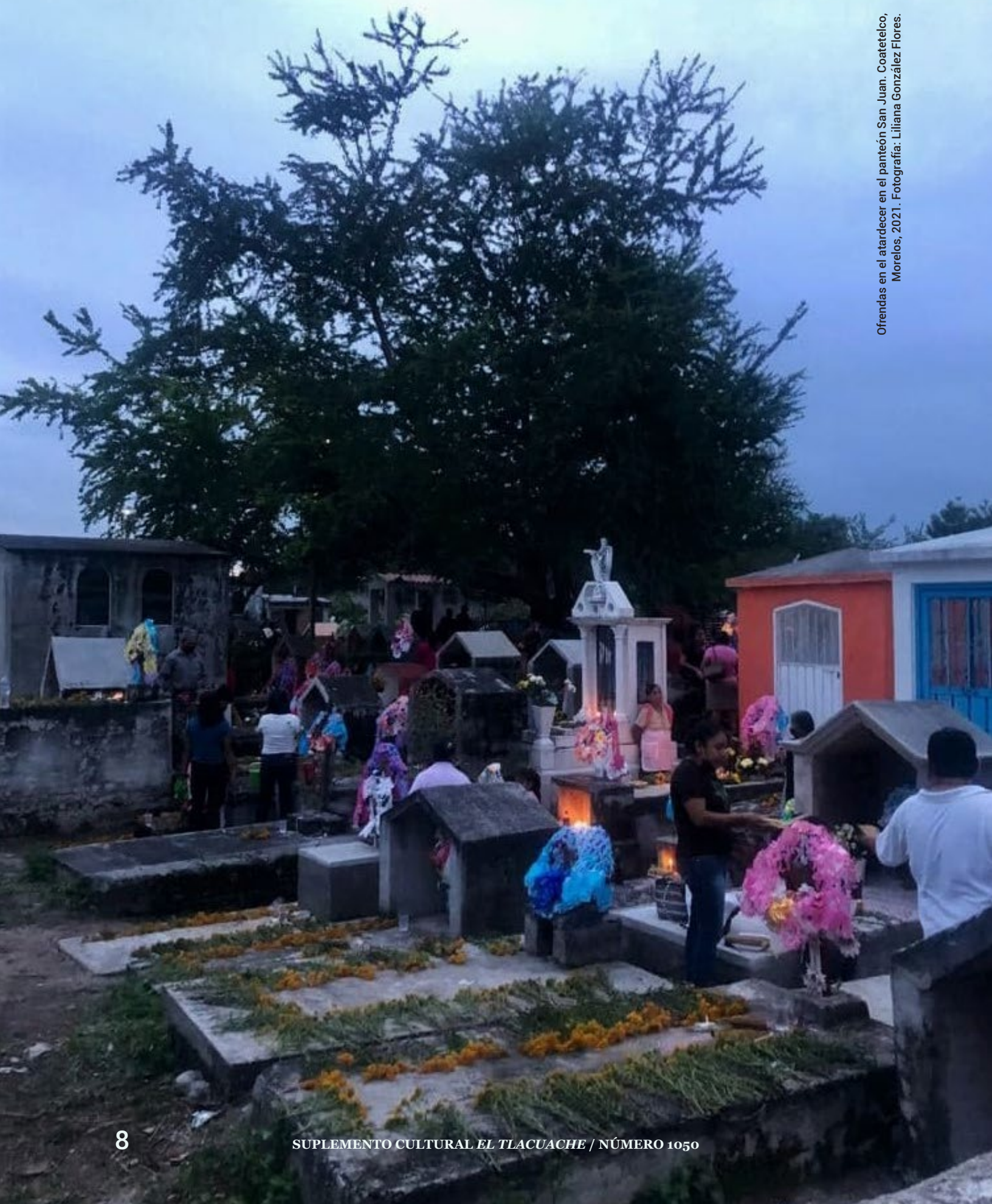
Ofrendas en el atardecer en el panteón San Juan. Coatetelco, Morelos, 2021.