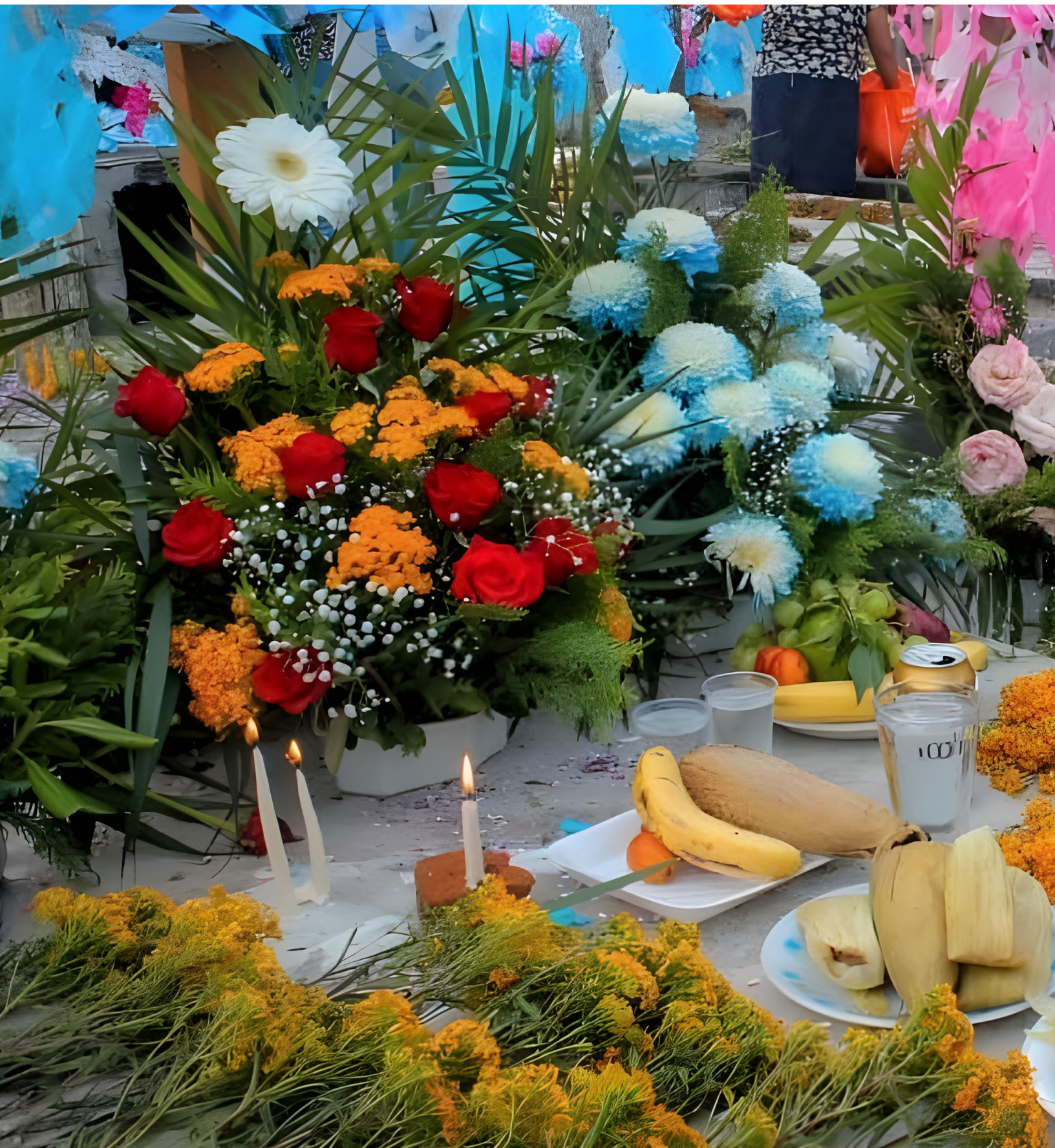
Páginas 10 y 11. Ofrendas adornadas con flor de yautli o pericón. Coatetelco, Morelos, 2019.