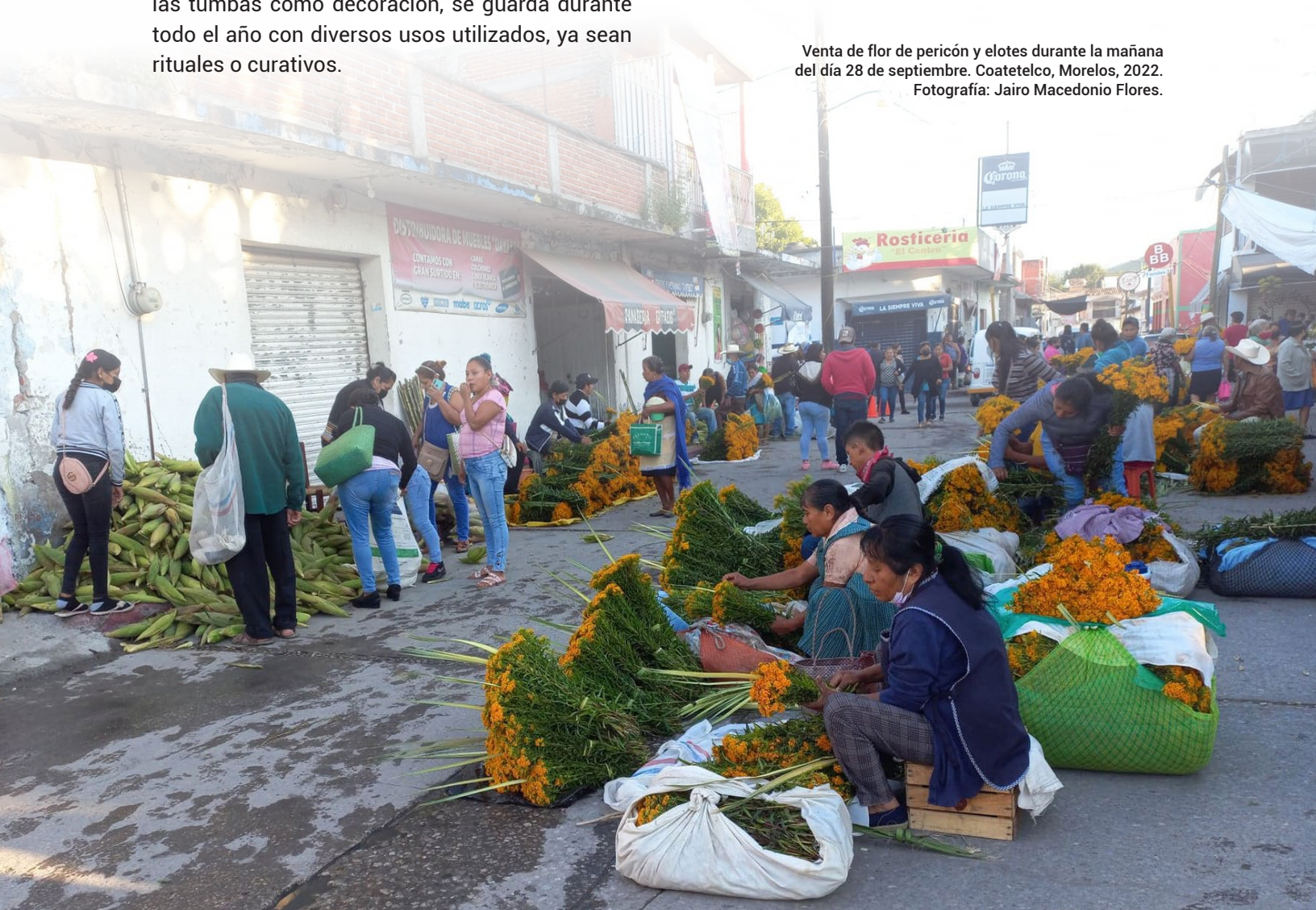
Venta de flor de pericón y elotes durante la mañana del día 28 de septiembre. Coatepec, Morelos, 2022.

Las personas que no se dedican al cultivo agrícola, con anticipación encargan docenas de elotes a los campesinos que se dedican al cultivo de maíz o a quienes en esa fecha tienen elotes para la elaboración de los tamales; algunos más concurren ir al mercado a comprar con los campesinos de la localidad que acuden a vender elotes crudos a las afueras del mercado municipal, en su mayoría elotes "costeños" o de maíz "prietito" que se diferencian de otros tipos de maíz por tener la cualidad de tener el grano más suave y dulce.