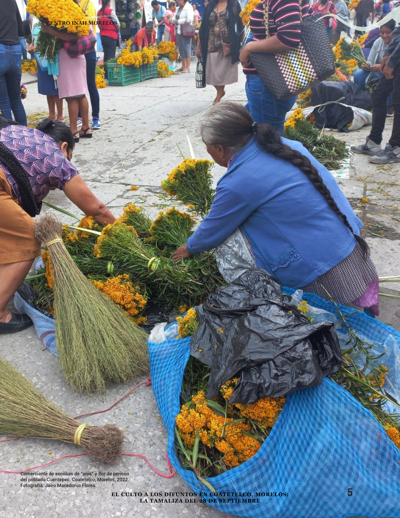
Comerciante de escobas de "anís" y flor de pericón del poblado Cuentepec. Coatepec, Morelos, 2022.