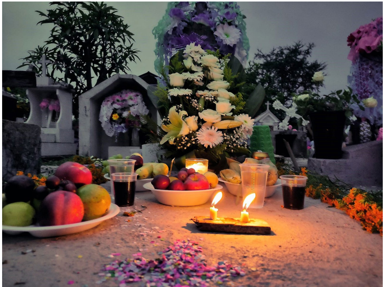
Velas de sebo iluminando la ofrenda. Coatetelco, Morelos, 2021.

Todo el mes de octubre la población continúa rindiendo culto a los difuntos por medio de un altar doméstico, durante ese mes colocan diariamente por la noche una pequeña ofrenda, consistente en un jarro o vaso con agua, encienden una veladora de parafina y colocan alguna fruta, con la finalidad de recibir por las noches a aquellas almas que comienzan a llegar desde ese mes.