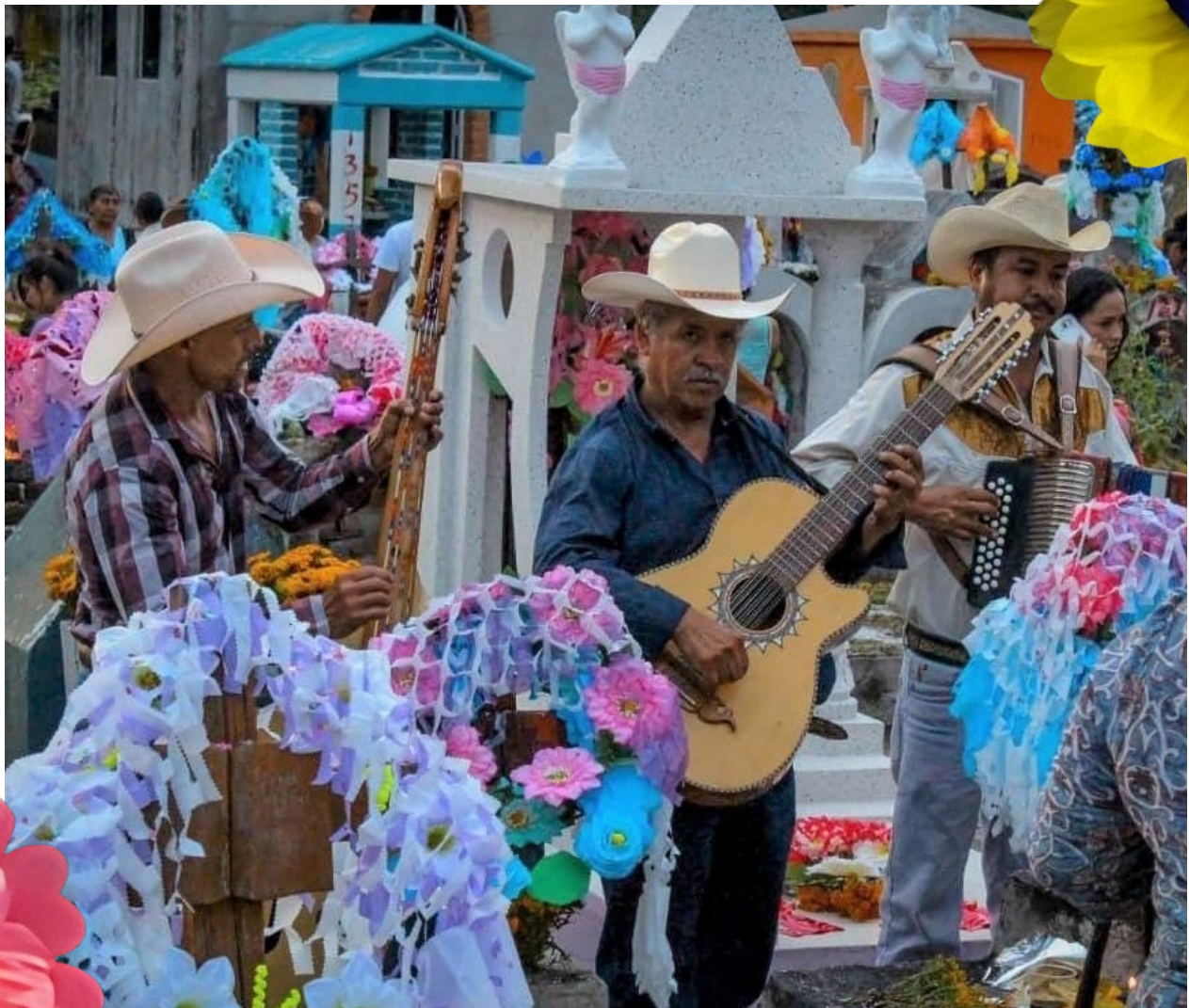
Músicos durante el festejo del día 28 de septiembre. Coatetelco, Morelos, 2019.

El culto a los difuntos en Coatetelco comienza desde el día 28 de septiembre, y a pesar de no haber alguna imagen de San Miguel, la población relaciona estas ofrendas con este santo, continuando el culto a los difuntos todo el mes de octubre desde el día 1, culminando hasta el día 2 de noviembre cuando se recogen las ofrendas colgantes o Huatlapextles.