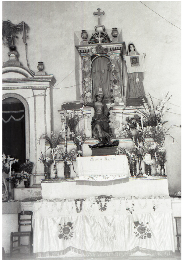
Altar de la Capilla de Los Reyes en Tepalcingo, Morelos.

las imágenes técnicas. 5 Pero el interés por establecer colecciones fotográficas es relativamente nuevo, tanto en escalas nacionales como regionales. ¿Cómo están conformadas las colecciones fotográficas a nivel regional en México?, ¿cómo se inscribe la creación de las fototecas regionales en el contexto de los programas nacionales de conformación de colecciones fotográficas estatales?, ¿cómo se conforman las colecciones fotográficas en Morelos? El presente ensayo busca estudiar la conformación y robustecimiento de la colección fotográfica de la Fototeca Juan Dubernard, del Centro INAH Morelos a lo largo de casi treinta años (1994- 2021). Para ello, se reconstruye el contexto histórico nacional y regional que permite comprender el nacimiento de la fototeca en el contexto del impulso por el rescate de acervos fotográficos promovido desde el Sistema Nacional de Fototecas (SINAFO).