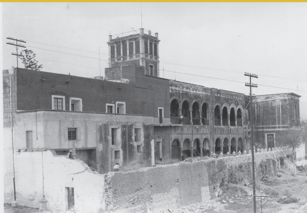
Derrumbe de muro en la parte oriente del Palacio de Cortés en 1948. Cuernavaca Morelos.

Centro INAH Morelos Mariano Matamoros 14, Acapantzingo, Cuernavaca, Morelos.