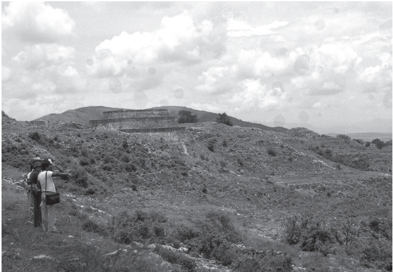
Inspección arqueológica en Xochicalco en 1986.

La creación de imágenes dotadas de una visión objetiva tanto en la antropología como en las labores arqueológicas partían de una visión científicista, pero también de un principio de catalogación de artefactos extraídos de distintas comunidades que conformarían parte de las colecciones de los museos tanto regionales como nacionales. Varios objetos y fotografías obtenidos en exploraciones durante el siglo XIX fueron depositados en museos e institutos de investigación, conforme la antropología emergió como disciplina profesional estas instituciones enviaban a sus propios expedicionarios para reunir colecciones extensas. 10 El registro etnográfico y de piezas arquitectónicas, arqueológicas, históricas y artísticas exigía una representación verosímil del objeto a inventariar, clasificar, catalogar e investigar. Ese registro del pasado tuvo su origen en el positivismo decimonónico, en el que el dibujo y la fotogra-