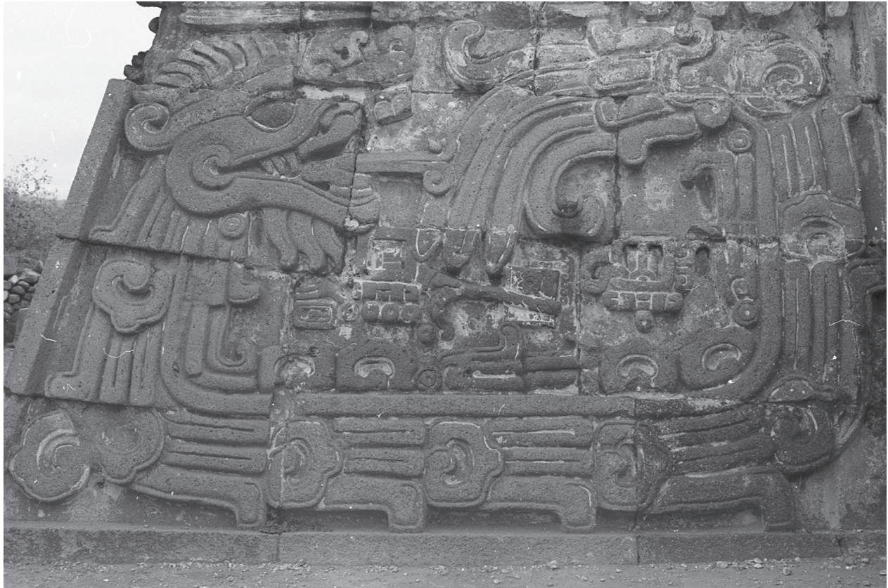
Ajuste calendárico. Vista parcial del templo de las Serpientes Emplumadas en la zona arqueológica de Xochicalco cerca de 1985.

para dar paso posteriormente al Museo Regional Cuauhnáhuac. A partir de este momento, se inició el registro fotográfico de los trabajos de restauración y excavación realizados en el museo pues el proceso de restauración había provocado el descubrimiento de “[...] muros en talud de altas estructuras, escalinatas, estructuras de planta circular, que evidencian lo que fueron templos y palacios ordenados en el amplio espacio del centro cívico- ceremonial del señorío más importante de los valles de Morelos [...]”. 17 El museo fue inaugurado el 1 de febrero de 1974 después de tres años de trabajo de restauración. 18 Cabe destacar que