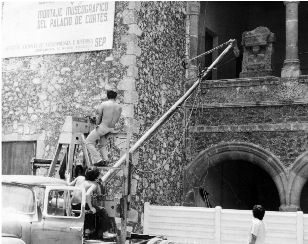
Traslado de Xochiquetzal, diosa de la fertilidad proveniente de Xochicalco al nuevo Museo Regional Cuauhnáhuac.

identidad nacional a partir de un discurso proveniente del Estado: