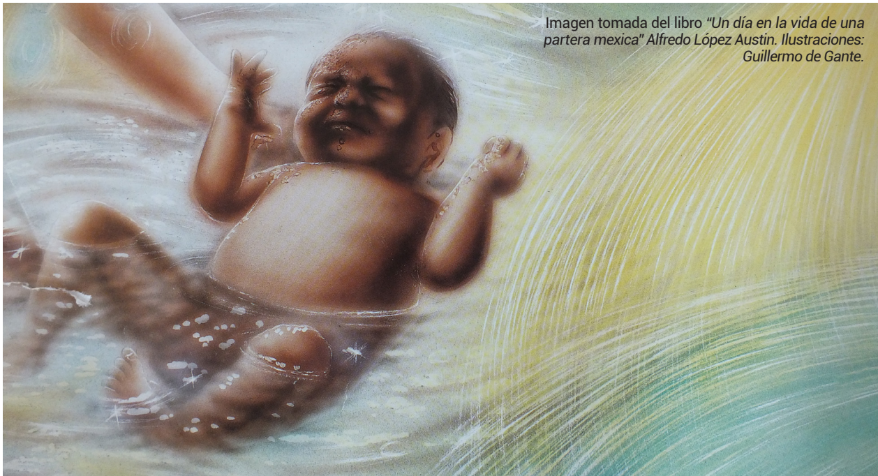
Imagen tomada del libro "Un día en la vida de una partera mexicana" Alfredo López Austin. Ilustraciones: Guillermo de Gante.

Sin embargo, existen organismos, asociaciones, hospitales y programas que están a favor del parto humanizado y respetado, en donde la mujer y/o la pareja deciden cómo será el parto, en dónde y con quién (es), así, el cuerpo femenino se ha convertido en un nexo de autoafirmación y