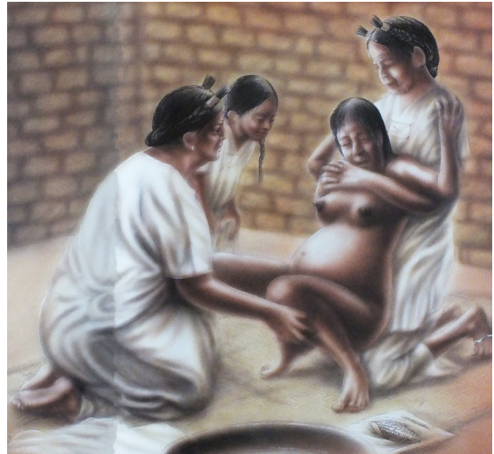
Imagen tomada del libro "Un día en la vida de una partera mexicana" Alfredo López Austin. Ilustraciones: Guillermo de Gante.

malestares, ni dolores, entonces yo creo que la propia dinámica del trabajo de campo no te permite estar con malestares y dolores. Porque yo de pronto le comenté —es que usted sí podía cargar pesado— y pues me decía —pues sí, llevaba las tortillas, llevaba la comida, las tortillas y pues caminaba— entonces decía que cuando ya iba a nacer alguno de mis tíos, este... lo que hacía era preparar, como la comida, las tortillas por lo menos y los demás... tuvo 8 hijos, las mayores, en este caso... mi mamá fue la segunda hija, este pues ya tenían por lo menos qué comer o darle a sus otros hermanos, fue como esa parte, ¡eh! y mi mamá, nada más me cuenta que... eso ya me lo contó hace mucho, como que no hemos retomado el tema de cómo nací y cómo fueron los dolores y todo. Entonces fue un parto natural, fue en un hospital, entonces fueron algunas horas de dolores y contracciones, entonces no tuvo ningún problema, en este caso, cuando nací [...]" (2015) A partir de lo que su abuela y su madre le contaron, ella junto con su pareja tomaron la decisión de vivir un parto con la presencia de una partera y que no sea en hospital. Yinhue: "[...] estoy bien de salud, afortunadamente, no tuve ningún malestar [durante el embarazo], entonces dije, —bueno tengo las condiciones físicas para poder tener un parto natural— porque el médico me dijo que —definitivamente natural no, que tenía que ser cesárea—. Entonces se me empieza a meter la idea de la partera, creo que muy relacionado con la