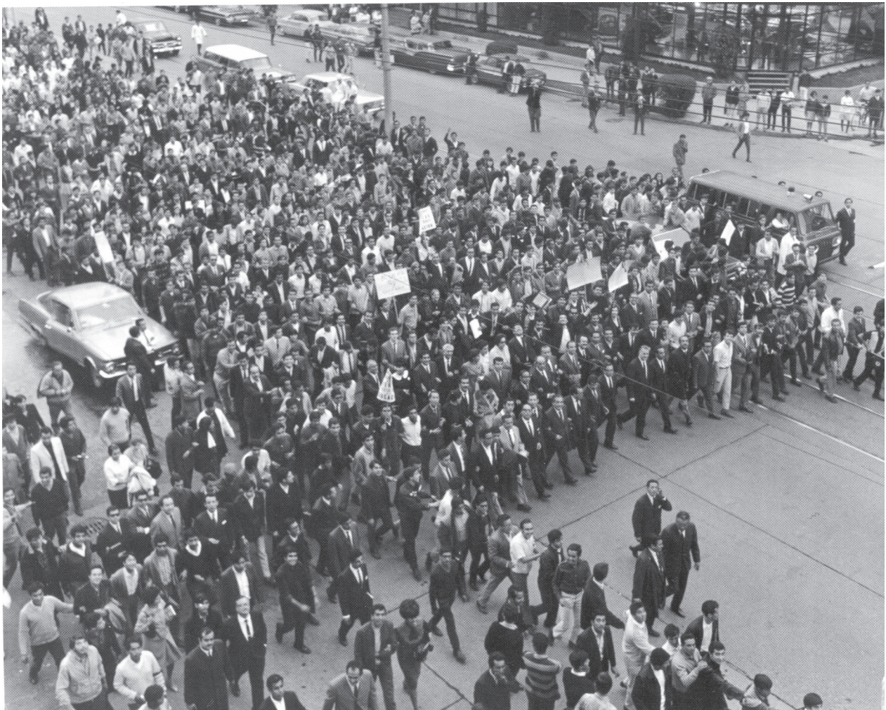
La marcha del rector el 1 de agosto de 1968. Rodrigo Moya. AFRM.

Un primer caso está representado por la fotografía de Pedro Meyer que ocupa la portada del libro más influyente sobre el 68, La noche de Tlatelolco , escrito por Elena Poniatowska y publicado por la editorial ERA en el año de 1970, todavía bajo la amenaza del régimen criminal de Díaz Ordaz. Dicha foto se refiere a la protesta callejera estudiantil correspondiente al mes de agosto del 68 y posee un carácter festivo, con la participación de un par de mujeres en un primer plano y la dramatización o performance del sepelio del sistema político mexicano. En la jerga de aquellos años, se trata de la escenificación de un happening, con su carga alegre, y contestataria, cargada de histrionismo. En la portada del libro esta imagen se oscurece