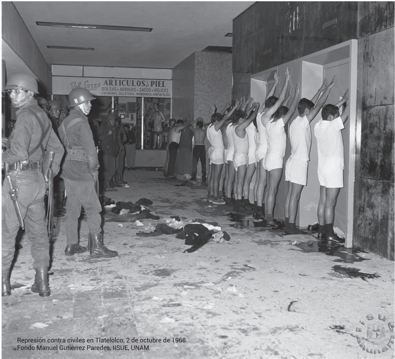
Represión contra civiles en Tlatelolco, 2 de octubre de 1968.

tud que no fue patrimonio de las izquierdas, sino que incluyó a esta parte beligerante de una derecha defensora de la represión, la religión católica y la institución castrense.