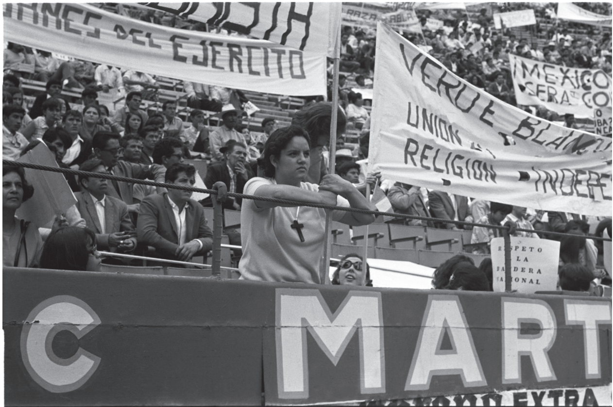
El mitin del MURO en la Plaza México, 9 de septiembre de 1968.

ca desde la perspectiva del presente para posicionar una protesta social de corte latinoamericano con una resonancia a nivel internacional.