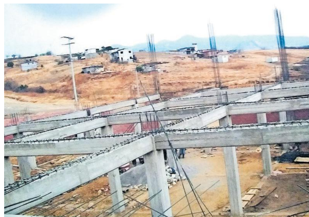
La colonia Jericó y la construcción del templo hace 8 años. 15 de abril de 2011

Desde niña migró a la ciudad de México por motivos laborales. En la ciudad se encontró con diversos cultos y organizaciones, pero señala que el tipo de iglesia que más le gustó por su organización, prácticas, doctrina y el carisma de su H-