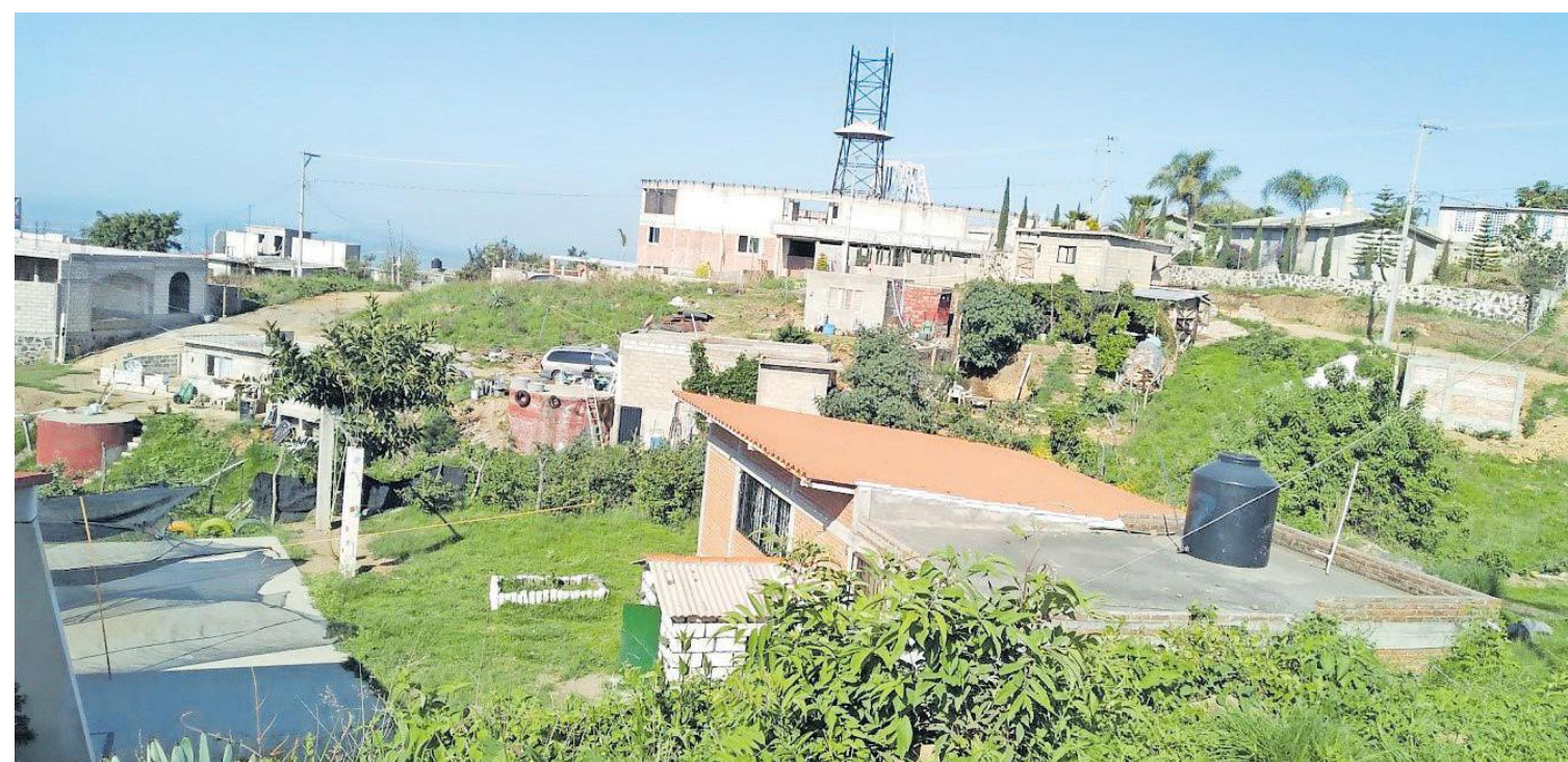
La colonia Jericó en la actualidad. La torre de hierro sobre la construcción circular es el templo.

a ir, hay muchas maneras de servir a dios y no es así como tú quieres de dejar todo. Pero a mí me gusta esto.