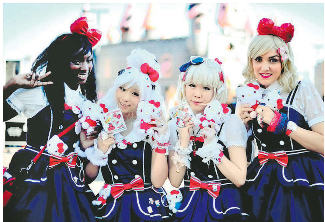
Ejemplos de consumo cultural asiático.