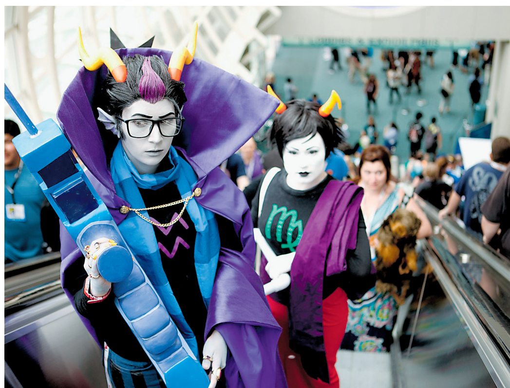
Imagen de la Comic-Con en San Diego

Forbes en 2018 calculó un estimado de 90 millones de personas a nivel mundial dentro de los fandoms . De 2016 a la actualidad hubo un aumento de 30 millones.