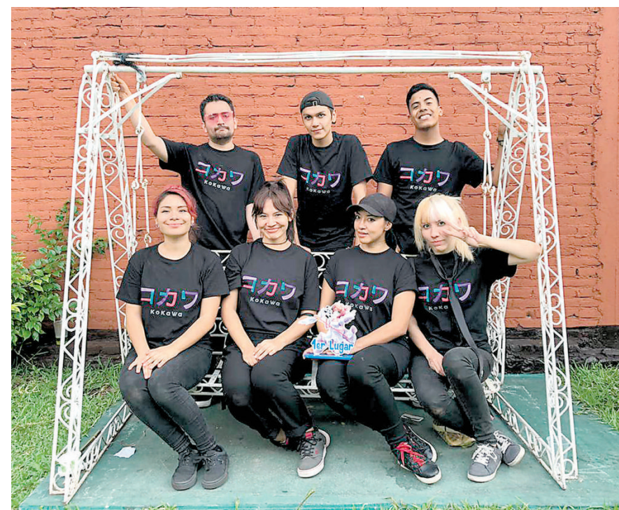
KOKAWA grupo de K-pop dance cover.

En años recientes, se formuló el concepto de lo biocultural como parte de los debates y las prácticas de la etnobiología y la etnoecología, de manera central. Ello responde, sobre todo, a la necesidad de redefinir un campo de estudio donde las fronteras entre lo natural y lo cultural se van difuminando, mismas que habían sido muy bien delimitadas por los paradigmas originados en la ilustración científica, los que separaban e incluso oponían lo cultural y lo natural.