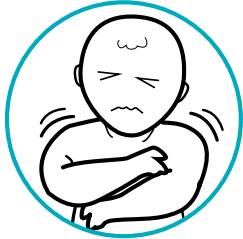
Lagnat at panginginginig