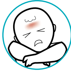
Kapaguran at pananakit ng ulo