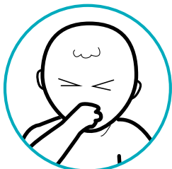
Alibadbad, pagsusuka, at/o diarrhea