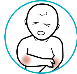
Pananakit ng kalamnan at kasu-kasuan