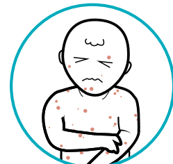
Pagkatapos ng MMR at varicella vaccines: maaaring magkaroon ng lagnat, pantal-pantal, at iba pang side effects mga 1-2 linggo pagkatapos mabakunahan