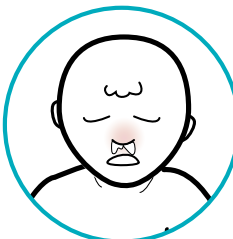
Pagkatapos ng nasal spray influenza (flu) vaccine: baradong ilong at tumutulong ilong