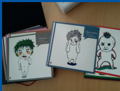
Finnország, Kuovola. A gyermekek meghallgatásához használt, az életkoruktól és a fejlettségüktől függő anyagok.