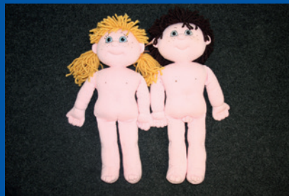
Tallinn, Észtország. A gyermekek meghallgatásához használt babák.