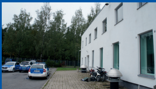
Észtország. Külön bejárat a tartumaa-i áldozatsegítő központ épületének hátsó részén.

Észtországban a tartumaa-i áldozatsegítő központ ( Tartumaa Ohvriabikeskus ) az épület hátulján külön bejáratot alakított ki a különösen traumatizált gyermekek részére. Finnországban a tárgyalótermek némelyike szintén külön bejáratokkal rendelkezik, és az Egyesült Királyságban is a bíróságok egyik nagyra értékelt elemének tartják a külön bejáratokat és várószobákat.