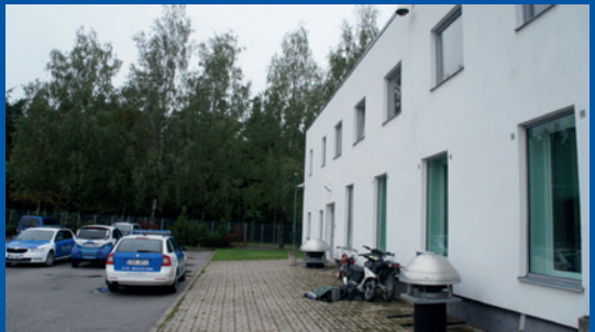
Εσθονία. Χωριστή είσοδος στο πίσω μέρος του κτιρίου του κέντρου υποστήριξης θυμάτων της Tartumaa.

Το κέντρο υποστήριξης θυμάτων της Tartumaa ( Tartumaa Ohvriabikeskus ) στην Εσθονία διαθέτει ειδική είσοδο στο πίσω μέρος του κτιρίου του για παιδιά με σοβαρά ψυχικά τραύματα. Κάποιες δικαστικές αίθουσες στη Φινλανδία επίσης διαθέτουν χωριστές εισόδους, ενώ οι χωριστές εισοδοί και αίθουσες αναμονής αποτελούν ιδιαίτερα θετικό γνώρισμα των δικαστικών κτιρίων του Ηνωμένου Βασιλείου.