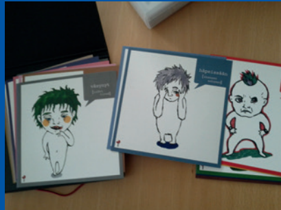
Φινλανδία, Κουνολα. Υλικό που χρησιμοποιείται κατά την ακρόαση παιδιών ανάλογα με την ηλικία και την ανάπτυξή τους.