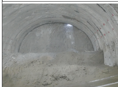
金山第一トンネル(実貫通写真)