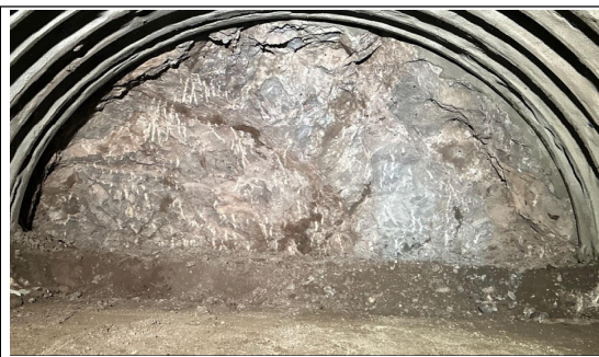
新及位トンネル（切羽写真）