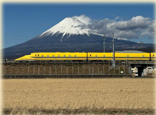
【ドクターイエローT4 ラストラン】