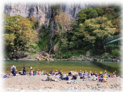
井倉洞は神秘的な世界