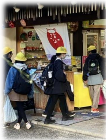
倉敷でお買い物!わくわく!

昨年度から行先もコースも変わりました。お天気にも恵まれ、大満足の修学旅行になりました。